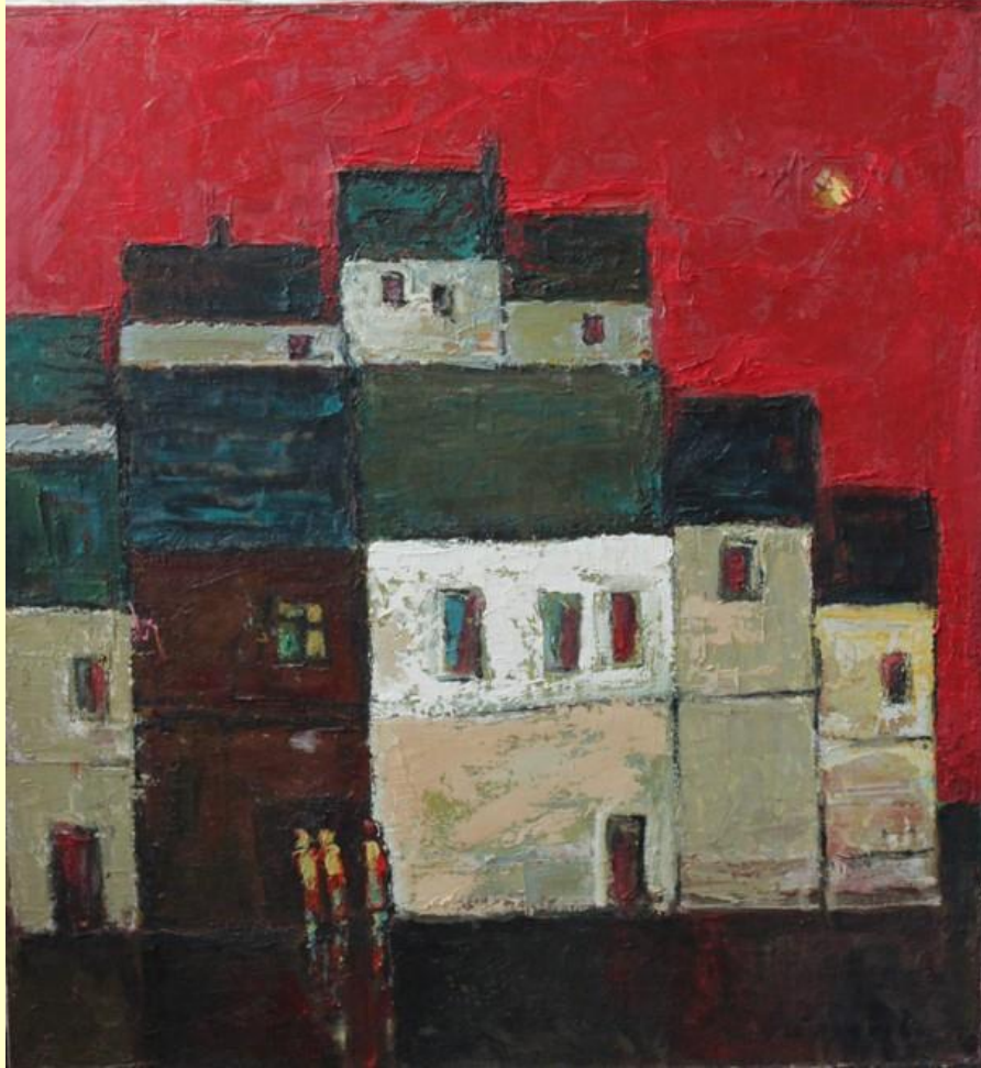
Володимир Остроухов Вечір. Прибалтика, 2007 Полотно, олія

Таким чином, мова абстрактного мистецтва, яка не відображує світ у знайомих кожному формах, є іносказанням безпредметної реальності