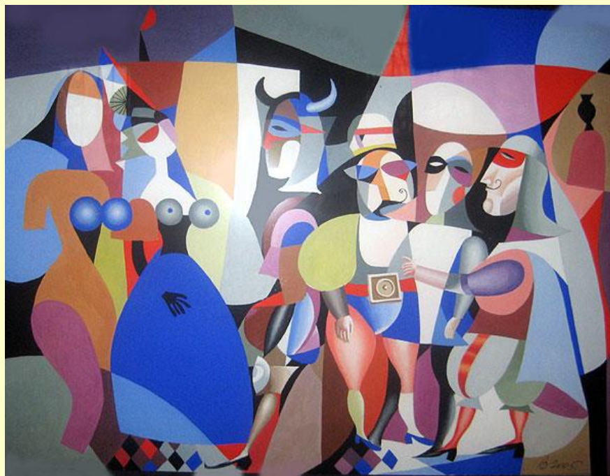
Федір Лагно . Карнавал масок, 2005. Папір, гуаш, акварель. 30 x 40

Прийоми абстрактного живопису, можливо, і сприймаються зовні як кілька примітивні, але вони можуть нести в собі занадто багато ідей, емоцій і смислів, не володіючи при цьому досить розвиненою живописною мовою, щоб їх висловити. Деякі дослідники вважають, що ХХ століття взагалі не створило мови для передачі абсолютно нового світу ідей і образів [1]. Використовуючи абстрактні форми, Федір Лагно актуалізує всі ознаки сучасності – ритм, темп, мозаїчність свідомості, гру культурним досвідом людства