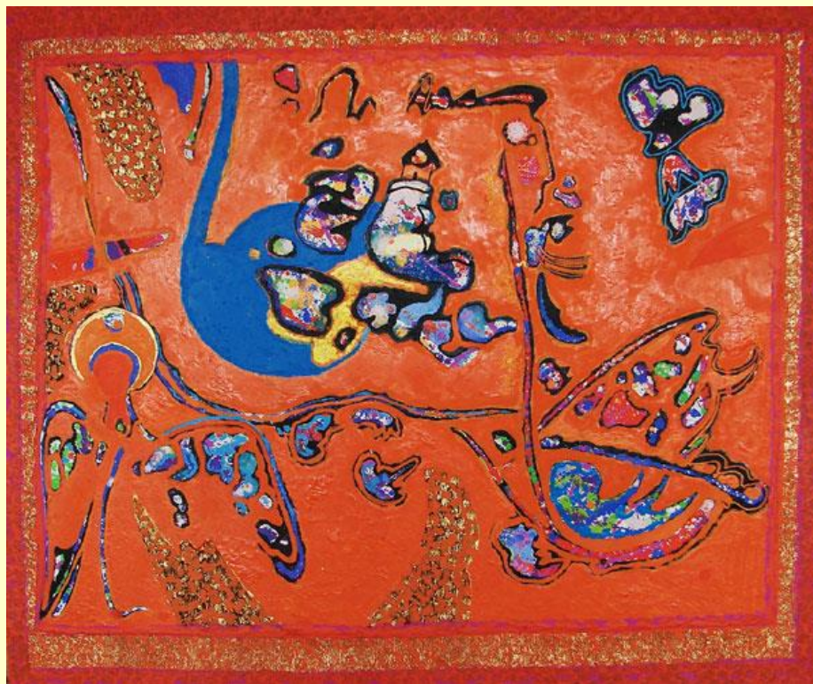
Володимир Товкайло. Пейзаж з жінкою, котом і Ангелом, 2014 Полотно, олія. 90 x 108

Нова безпредметність у певній мірі виправдовує найменування абстрактного мистецтва, тобто мистецтва усунутого від жодної конкретики, зверненого до «сфери духу», до архетипів, які зумовлюють і структуру форми, і будову простору. В картинах Володимира Товкайла вирішальним виразним засобом може виступати насичене колірне поле, на тлі якого виникають контрастні форми