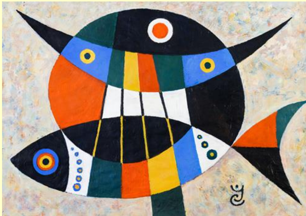
Ігор Смичек. Ковчег і риба, 2018 Полотно, акрил. 42 x 60

Абстрактний живопис відчуває особливу пристрасть до кольору, який стає головним виразом емоційного і символічного змісту. Звертаючись до міфологічних символів, Ігор Смичек активізує мову кольору. Впізнавані предмети, сюжети, образи видозмінюються, зберігаючи в собі пам'ять про те, що колись позначали, вся композиція відрізняється декоративною експресивністю