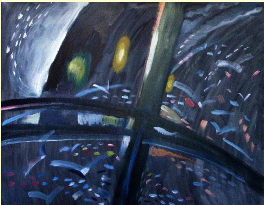
Андрій Надєждін. На світло. Із серії «Птахи», 2018 Полотно, олія. 85 x 100

До художників, які прагнуть до надання динаміки у картинному просторі, наповненому абстрактними символами з включенням фрагментів реального світу, належить і Андрій Надєждін . Його композиції завжди відрізняються особистими екзистенційними переживаннями