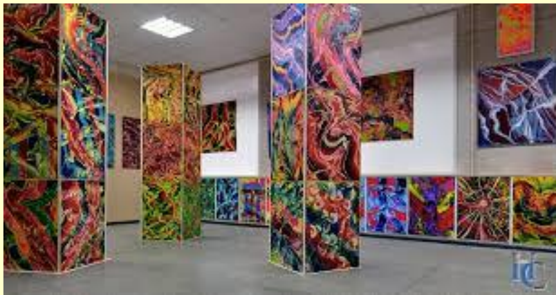
Виставка творів Олега Рудого

Безпредметність, яка ще на початку ХХ століття виявилася складним комплексом і синтезом теорії живопису, формотворчості, філософських пошуків і утопічних проєктів, сьогодні вийшла за рамки мистецтва в своєму наближенні до якогось дивного творчого акту на стику живопису і метафізики, заглибившись у внутрішній світ людини. Це стало причиною появи руху послідовників безпредметного мистецтва в усьому світі [3], саме цим можна пояснити розповсюдженість абстрактного живопису в сучасному культурному просторі