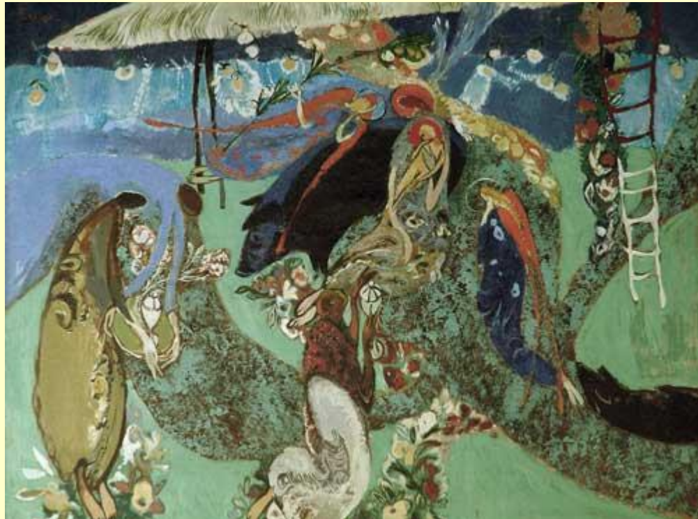
Григорій Гнатюк. Поклоніння волхвів, 1993. Полотно, олія

Можна побачити, що у митців Кіровоградщини звернення до абстракції не відрізняється стильовою монолітністю, що була властива абстрактному живопису початку ХХ ст., який розвивався за двома лініями – геометричної абстракції від К. Малевича і П.Мондріана та експресивної абстракції від В. Кандинського. Сучасні митці прагнуть до більш розширеного використання абстрактних мотивів, нерідко додаючи їх як елементи у фігуративну композицію, що навантажує зміст множинними смислами