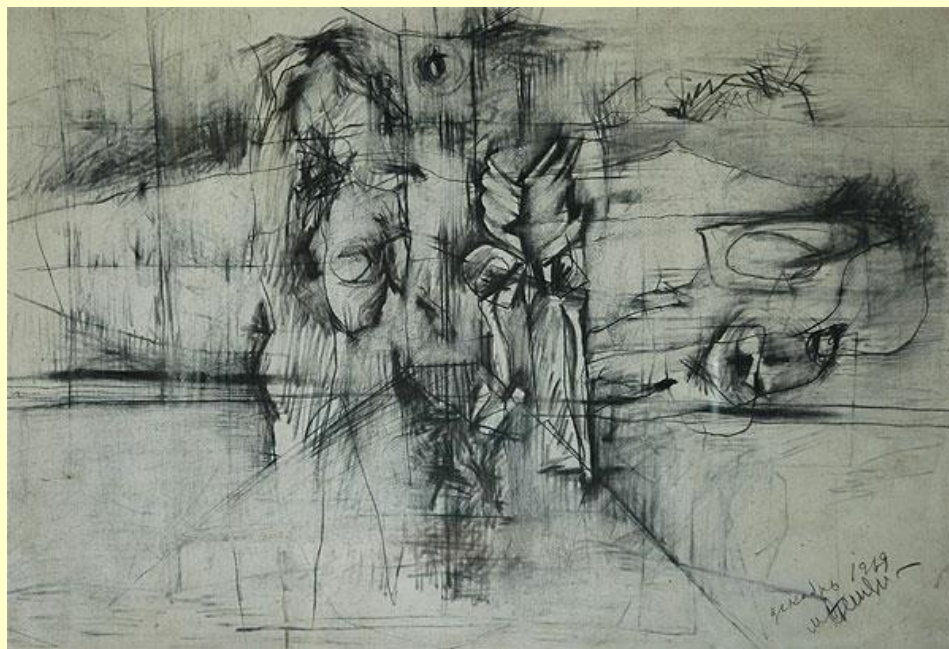
Михайло Надєждін. Сади Едему, 1969. Папір, вугілля. 56x80

Властивість відкривати світ, яка притаманна класичному мистецтву, притаманна також і мистецтву абстрактному. Спираючись на юнгівське співвідношення абстракції з інтровертною установкою, тобто зосередженістю на внутрішньому світі, можна зазначити, що абстрактний образ у мистецтві пов'язаний з підсвідомістю. Тому, наприклад, Михайло Надєждін демонструє, як, звертаючись до нефігуративних образів, можна використати певні культурні алюзії, які здатний прочитати підготовлений глядач