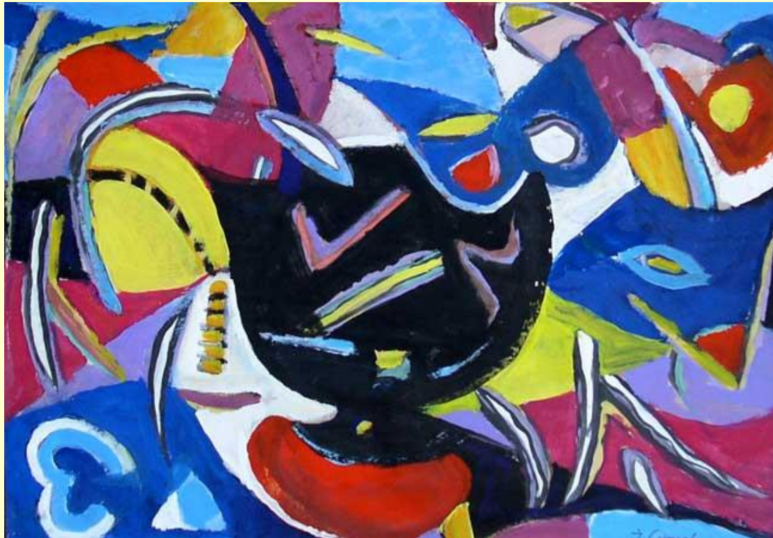
Ігор Смичек. Фонтан, 2015. Картон, акрил. 42 x 60

Кожен художник, який тяжіє до абстрактних форм, вирішує з їх допомогою певні естетичні завдання. Так, у творах Ігоря Смичека можна спостерігати святковість кольору, яка підтримується грою умовних елементів, за допомогою вільного розташування яких створюється загальна радісна атмосфера. В цій кольоровій динаміці глядач відчуває театральність, маскарадність, грайливість, саме абстракція й надає такий характер композиції