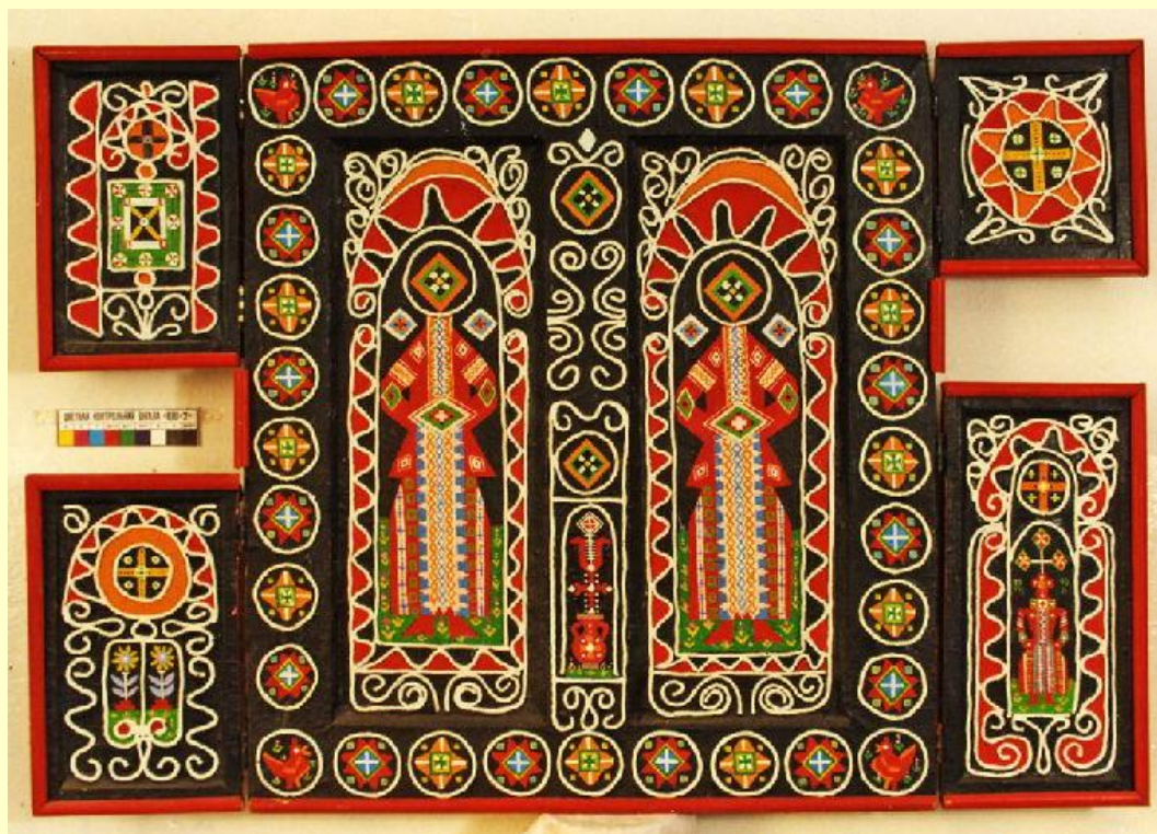
Юрій Гончаренко. Джерело живої води, 1998 Дошка, олія, мішана техніка

Використовуючи архетипні конструкти, художник як би розповідає якусь давню історію, а глядачеві залишається прийняти його умови і спробувати прочитати ту мову, яку йому пропонує художник. У Юрія Гончаренка кожен символ ускладнений включенням у нього іншого символу-знаку. Образ набуває особливу пластичну виразність, його формотворчі дії як би самі створюють нову мову