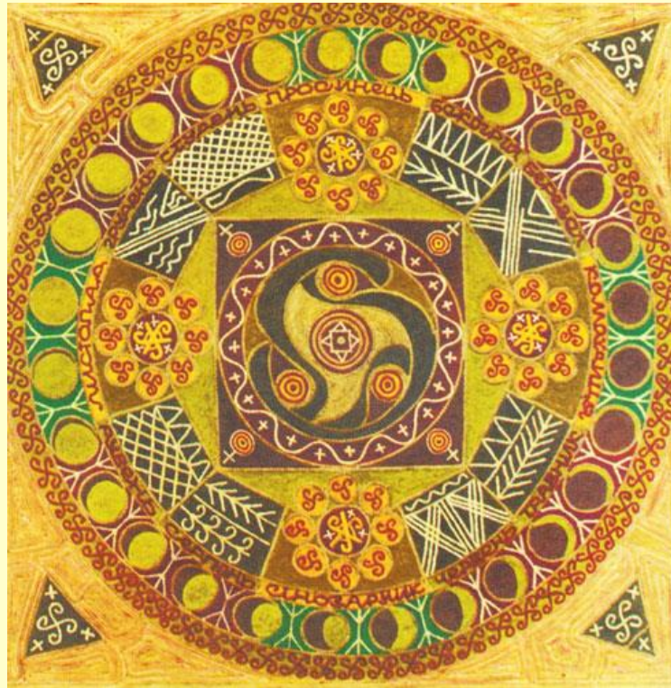
Юрій Гончаренко. Сонячне різдво, 2000 Дошка, авторська техніка. 60 x 60

Неоархаїка в сучасному абстрактному мистецтві, яка орієнтована на художній досвід давніх культур, як би реконструює архаїчне світорозуміння. Простота і ясність образотворчих мотивів старослов'янських орнаментів у складних конфігураціях Ю. Гончаренка відсилає до світовідчуття наших предків, до розуміння їхнього спілкування з явищами природи