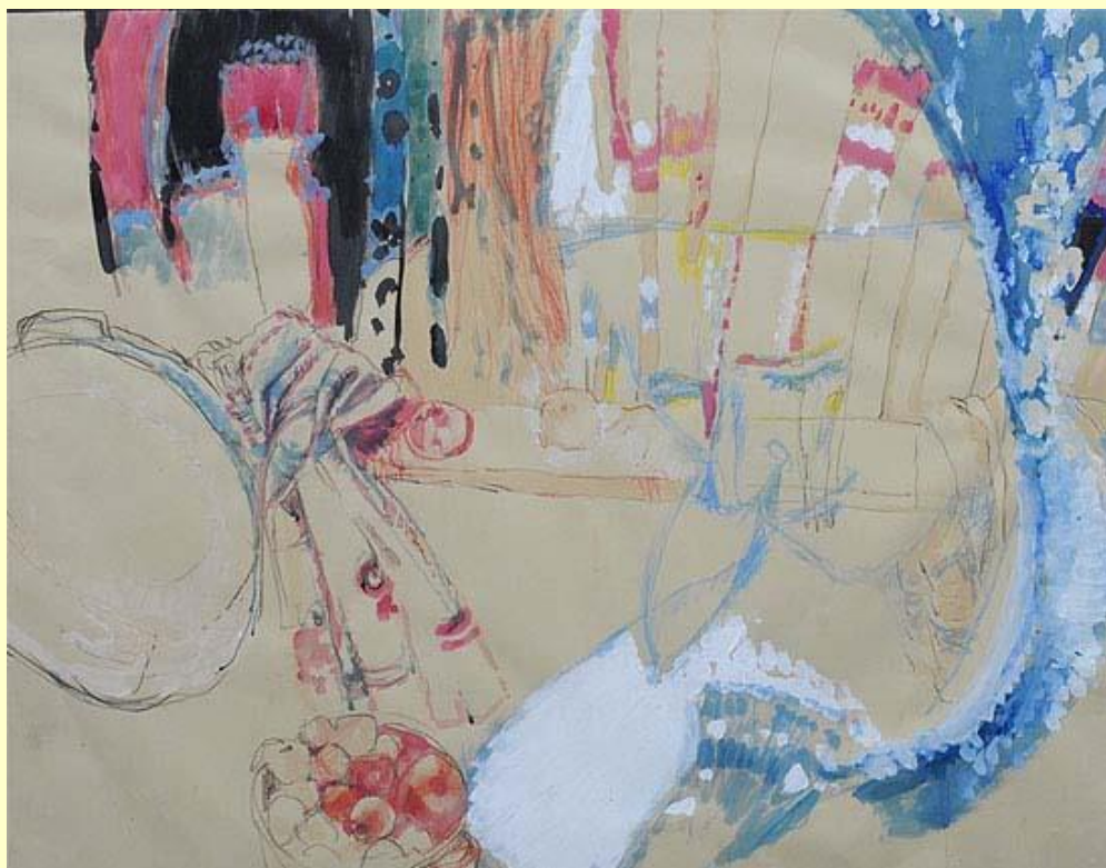
Григорій Гнатюк. Згадка, 1990. Папір, мішана техніка. 63x82

З'єднання абстрактних і природних форм занурює глядача в особливі умови, коли в нього виникає відчуття співавторства. Наприклад, та символічна структура картинного простору, яка властива творам Г. Гнатюка, не менш експресивна та насичена філософською глибиною, ніж це було у класиків чистого абстрактного живопису. Глядач розглядає серед напіваабстрактних елементів знайомі образи і створює власні асоціації