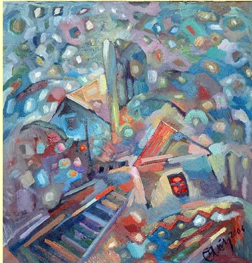
Андрій Нажедін. За лісами степ і гори або переїзд. Полотно, олія

Автор звертається до глибоких спогадів, які одночасно приховані в колективних шарах пам'яті, апелюючи до архетипів і вічних образів, тим самим пробуджуючи бажання глядача знайти деякі асоціації з власним життям. Таким чином художник як би апелює до колективної пам'яті людства