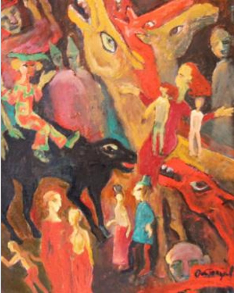
Володимир Остроухов. Реквієм, 2014 Полотно, олія

В чисто абстрактному мистецтві ми завжди бачимо синтетичне розуміння світу [1]. Живописний експресіонізм стоїть на межі реалістичного та абстрактного мистецтва, його вплив на глядача заснований на виразності кольору, фактури, деформаціях образів, композиційної точноїсті та авторського ставлення до світу