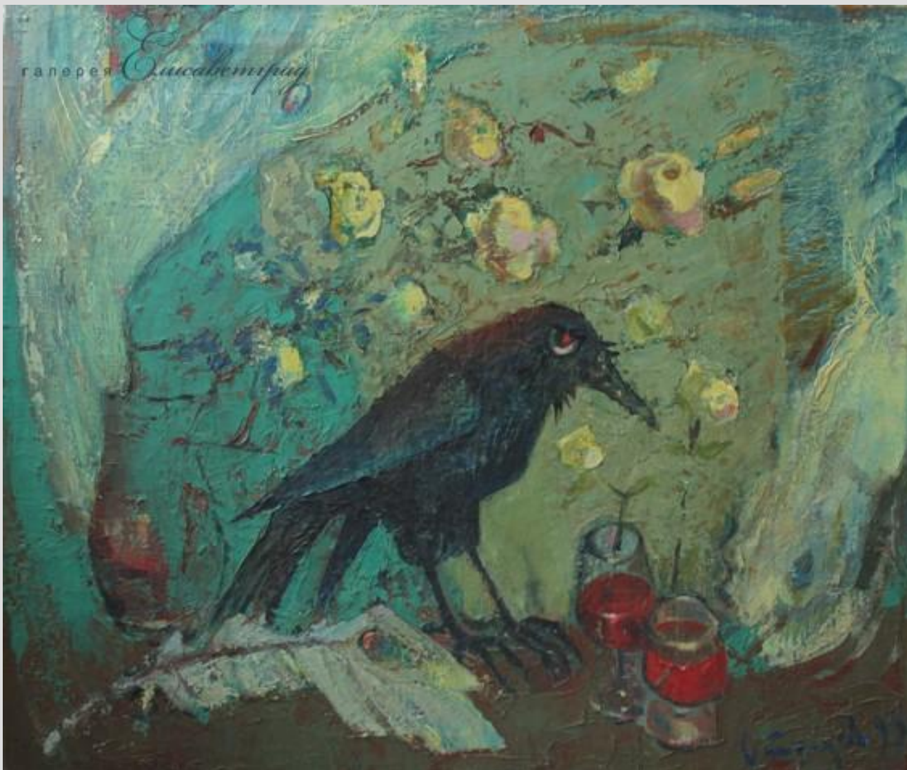
Володимир Остроухов. Гірке похмілля, 1993 Полотно, олія