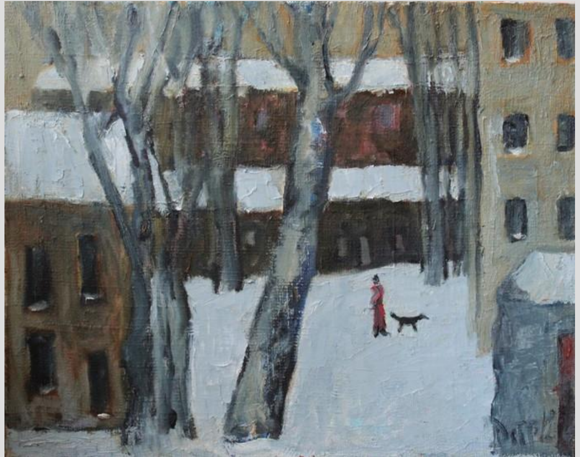
Володимир Острохов Зимовий день, 2012. Полотно, олія

Художній світ митця відрізняється оригінальністю бачення навколишньої реальності. Як підкреслює Микола Цуканов, “кожна написана ним картина має глибокий сенс, в який художник вклав самого себе, своє нелегке, часом трагічне життя і сучасність, яку останнім часом він бачить практично тільки з вікна власної квартири” [6]