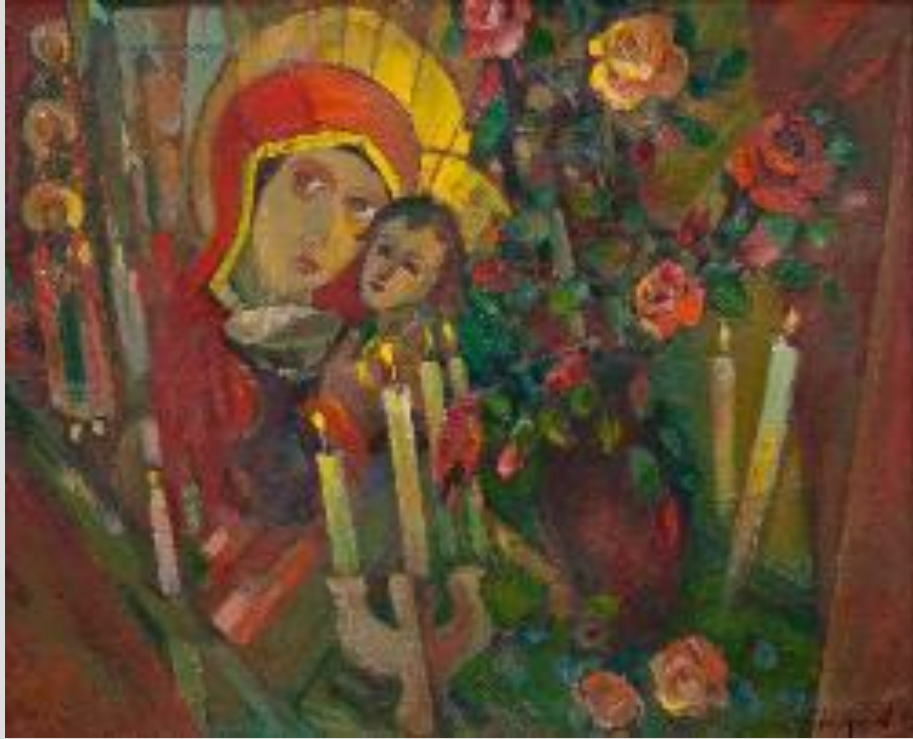
Володимир Остроухов Троянди пам'яті, 2003 Полотно, олія

У «Трояндах пам'яті» межа між тематичною композицією і натюрмортом відсутня, гама несе відчуття тепла і традицій, завдяки канонічно виконаній іконі, навколо якої ніби фрагменти витають квіти, свічки та різні сакральні образи. Сюжет плюс колір, плюс авторське бачення – все це подарувало нам таку глибоку роботу, що апелює до нашої моралі і духовності підсвідомо, ще до того, як ми прочитаємо назву