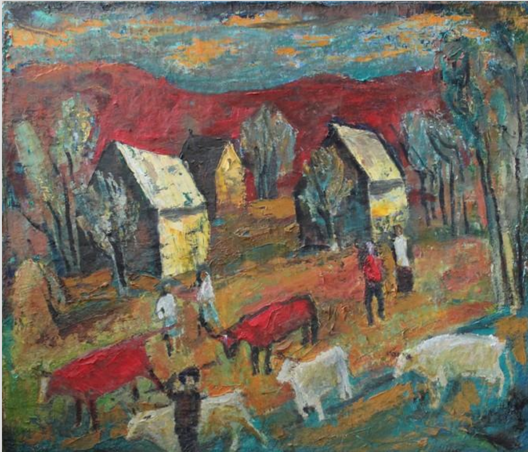
Володимир Остроухов Повернення стада Полотно, олія

В усіх роботах автора є спільна риса – це яскраве кольорове вирішення, навіть якщо кольори надані в розбілі чи темні – яскравість не зникає, досягається це завдяки поєднанню контрастних за кольором і тоном мас. Колір та співвідношення цих кольорових плям несуть усе емоційне, інформаційне навантаження, оскільки в деталі автор не вдається