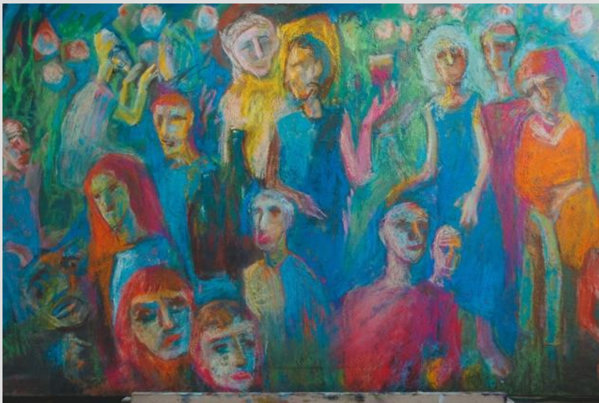
Володимир Остроухов. Композиція. Полотно, олія

Сюжети картин Остроухова народжуються в його уяві, часто це спогади про минуле, він говорить: “Включаю уяву, приходять асоціації, і виходить щось художнє” [3]. Переживши особисту драму, художник став переносити на полотна тему трагізму й самотності, а іноді як би згадує тих, кого вже немає поряд з ним