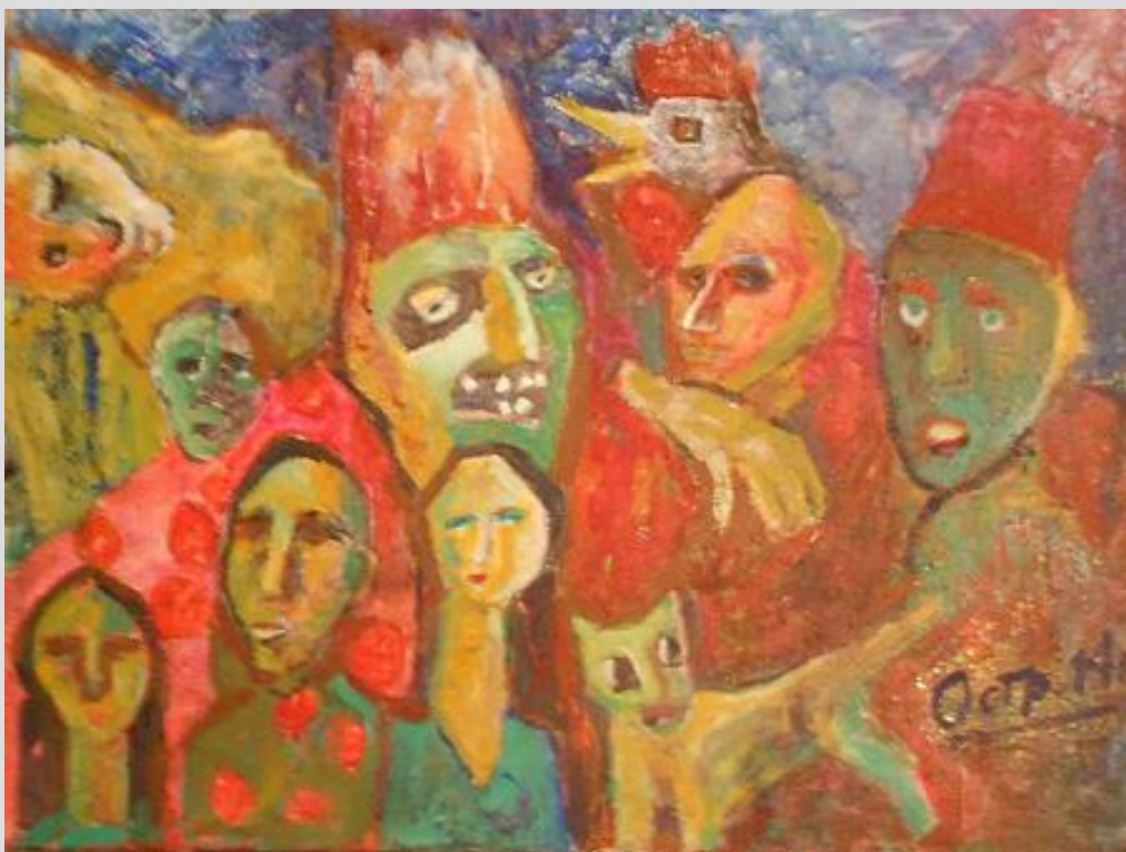
Володимир Остроухов Маски. Карнавал, 2014 Полотно, олія

Картини Остроухова, вважає А. М. Надєждін, “вирізняє критичний, часто іронічний погляд на сучасність, що народжує символічні образи клоунів та блазнів, людей добрих і злих, душі яких неначе відображаються у зображеннях птахів, дерев і будинків, змішуючись в єдиний симбіоз тривожного, сповненого величезної життєвої сили та напруги психопростору” [5]