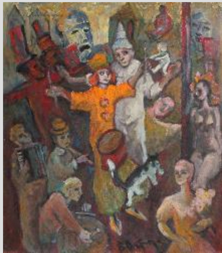
Володимир Остроухов Свято. Полотно, олія

Деякі митці повністю відмовляються від фігуративності, інші зберігають впізнавані форми, але роблять акцент на експресивній виразності кольору, який сприяє символізації образотворчої мови та організації композиційного простору творів