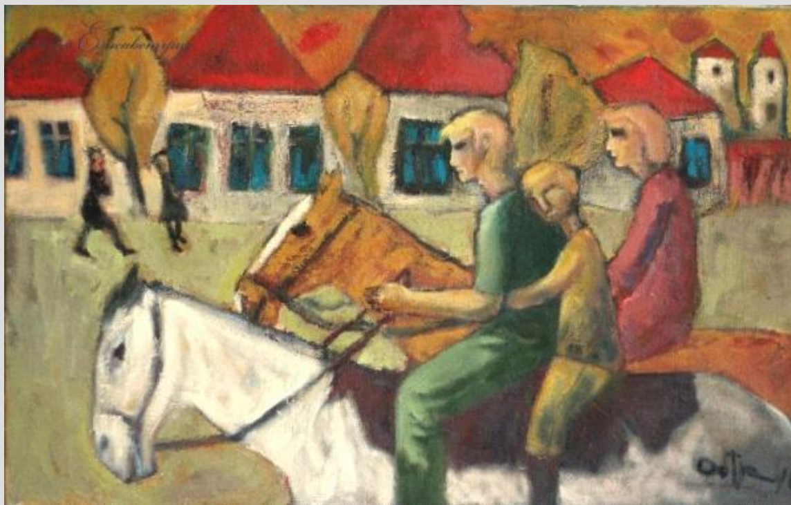
Володимир Остроухов. На коні. Полотно, олія

Можна зробити висновок, що мета живопису – це не тільки реалістична передача краси навколишнього світу, живопис набагато глибше і цікавіше та вирішує самі різнопланові завдання. Всі роботи художника відрізняє загальне поєднання яскравих кольорів, монументальний підхід, напруженість і легкість одночасно, вивіреність композиції. Творчість Володимира Остроухова актуальна і сучасна