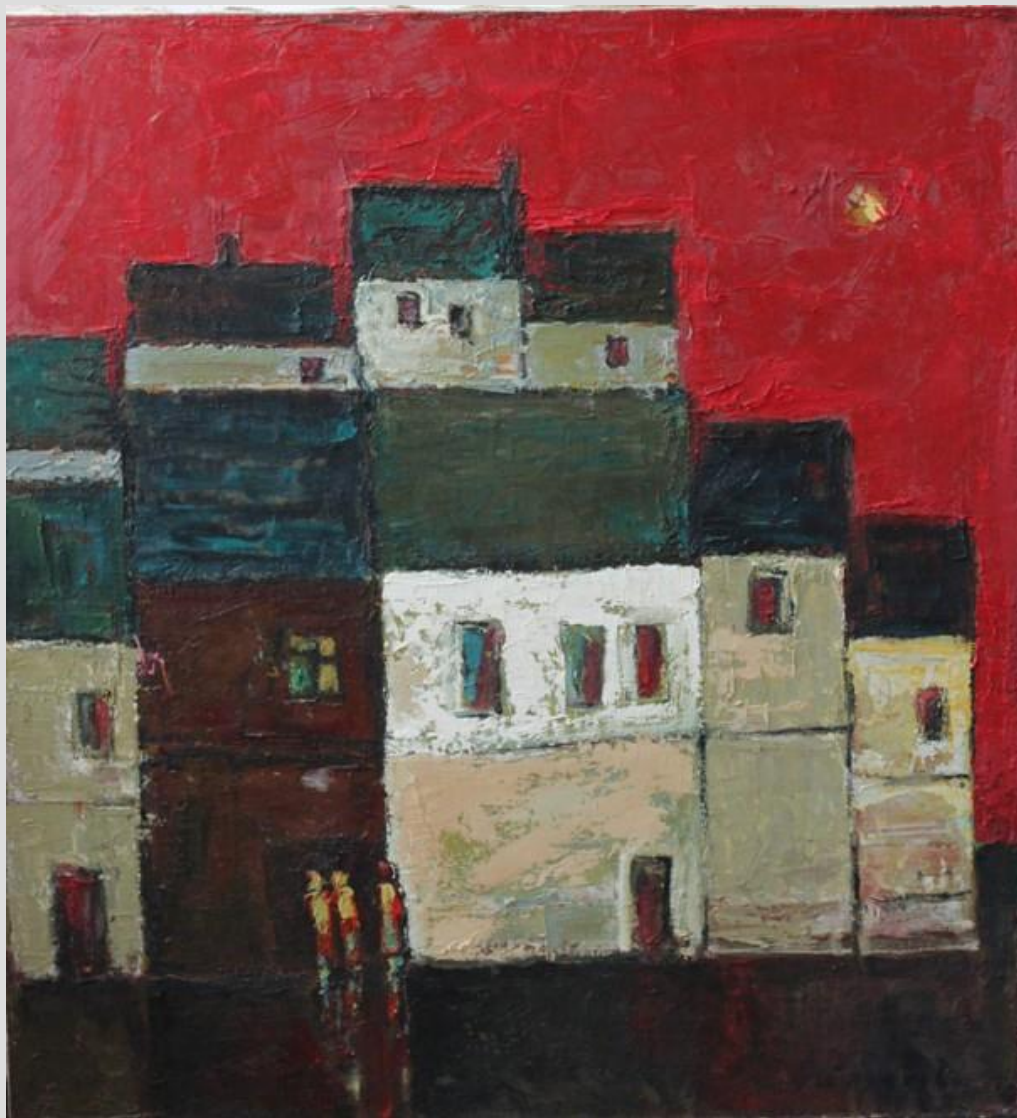
Володимир Остроухов Вечір. Прибалтика, 2007. Полотно, олія

В живописній техніці Остроухова чутно монументальний підхід, який оперує масами кольору і тону. Яскраві кольори і декоративізм знаходяться на межі нематеріального, що оперує до глядача і що ми бачимо в роботі «Вечір. Прибалтика»