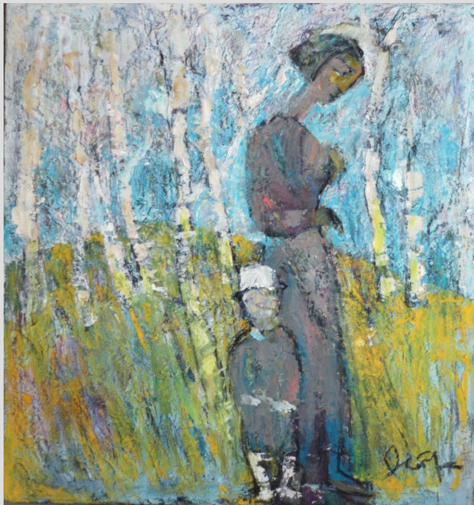
Володимир Остроухов Весна. Полотно, олія

Авжеж йдеться не про художню безграмотність, а про вільний підхід, обґрунтований на почуттях, власному баченні, як у підсвідомій, так і у свідомій потребі, що і є основою експресіонізму