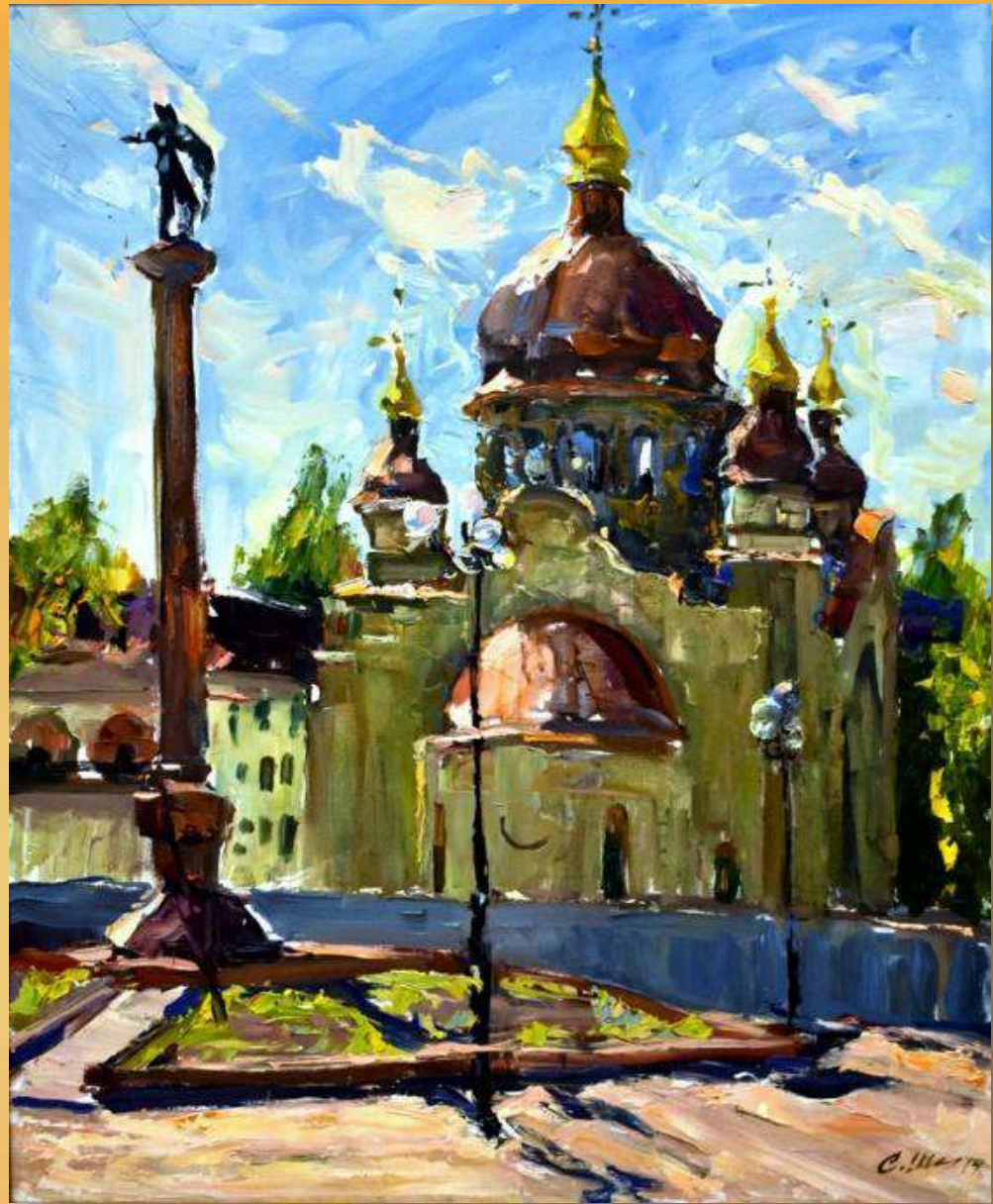
Сергій Шаповалов. Будується храм