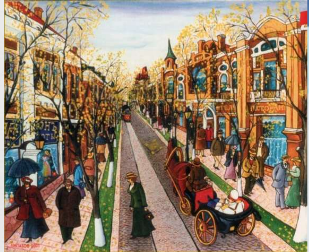
Променад на Двірцевій, 2001р.