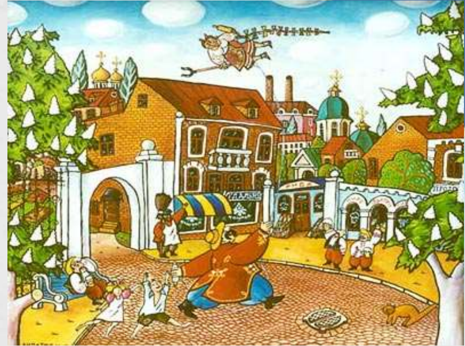
А.Ліпатов «Запускання повітряного змія» 1994р.

Твори талановитого художника Андрія Ліпатова знаходяться в збірках музеїв: художньо-меморіального музею О.О.Осмьоркіна, обласних художніх музеїв в Кропивницькому та Черкасах, музеях наївного мистецтва в Москві (Росія) та Бєро (Франція), Вихорлатському музеї (Гуменне, Словачія), Фонді культури Volpe Stressens (Буенос-Айрес, Аргентина) та в численних приватних