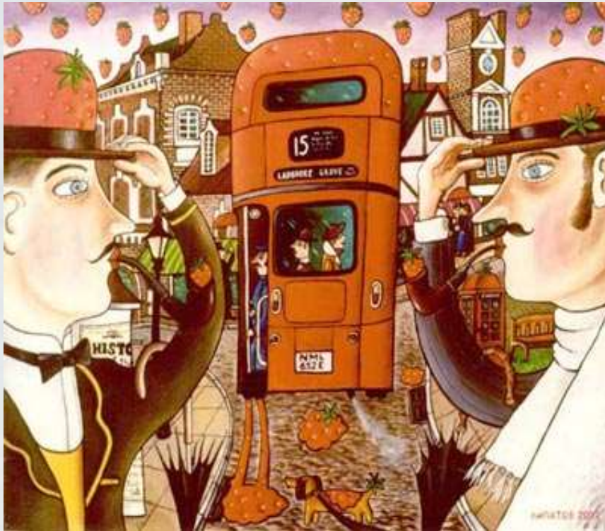
А.Ліпатов «Полуничний дощ» 2002р.

Все життя Андрія Юрійовича було прикладом самовідданого та безкорисного служіння мистецтву та творчого пошуку.