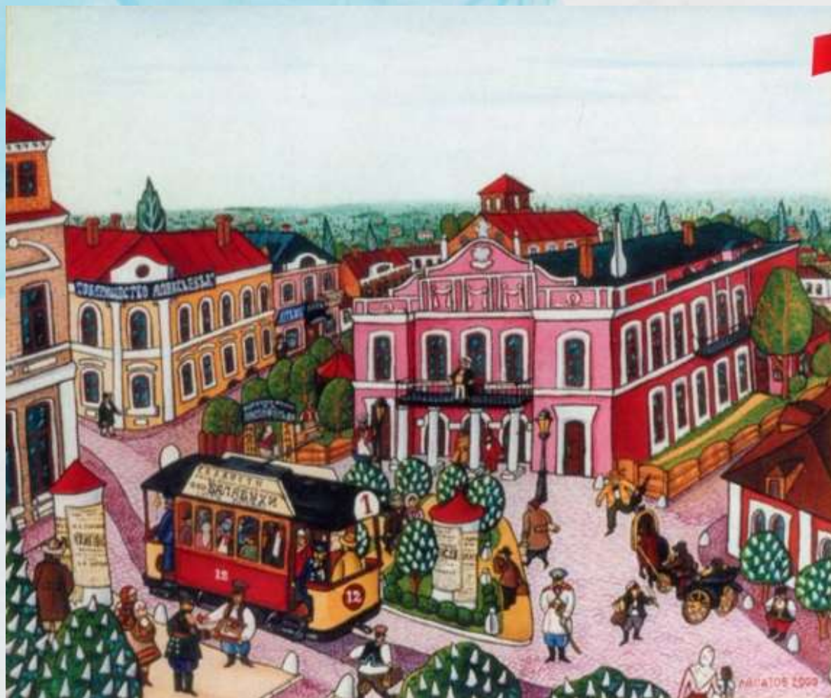
Театр Корифеїв ,2000р.