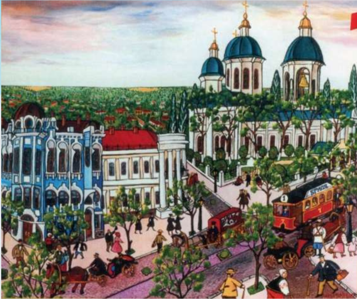
Успенський собор , 2010р.