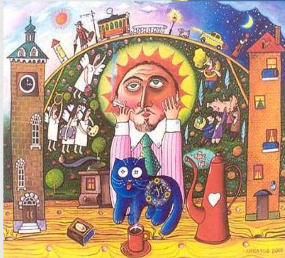
А.Ліпатов «Муки творчості» 2001р.

Персональні виставки неодноразово з успіхом презентувалися не лише в нашому місті, а й в Одесі, Києві, Москві (Росія) та Кембриджі (Великобританія). В 1999 році до 245-річчя нашого міста художник провів в художньо-меморіальному музеї О.О.Осмьоркіна вернісаж, на якому представив понад 40 живописних творів із серій: «Місто Єлисаветград» та «Народні картинки». А 2004-му власним коштом надрукував комплект сувенірних листівок «От вокзала до горсада», присвятивши його вже 250-річному ювілею рідного міста. Це унікальне видання і до нині не втратило своєї популярності.