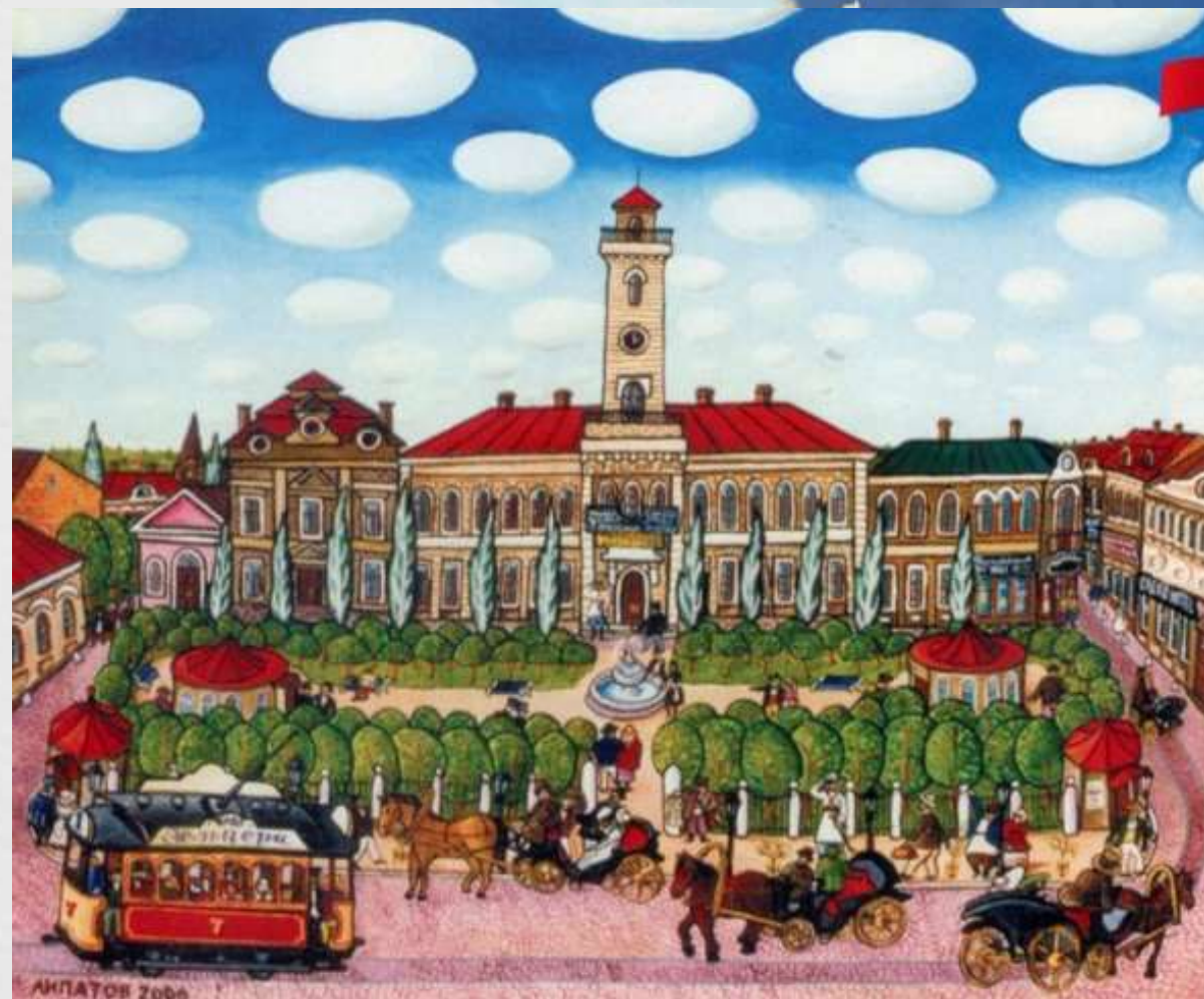
Міський бульвар, 2006р.