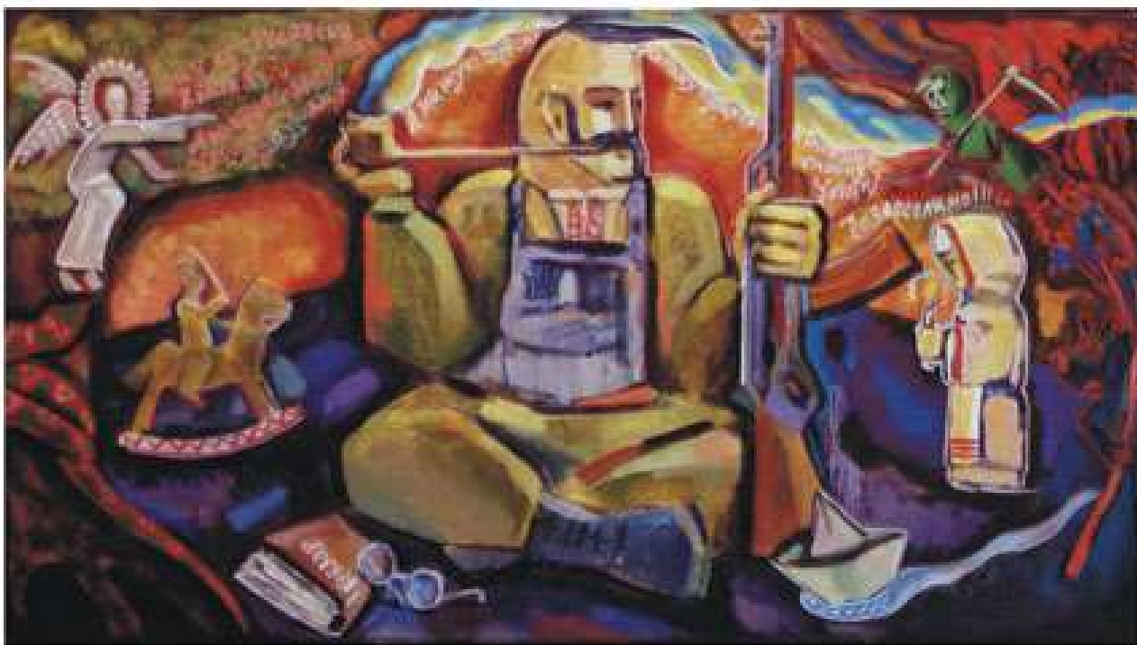
Мамай- захисник. 2014. Полотно, олія. 64x115 Мамай- защитник. 2014. Холст, масло. 64x115 Mamay – defender. 2014. Oil on canvas. 64x115