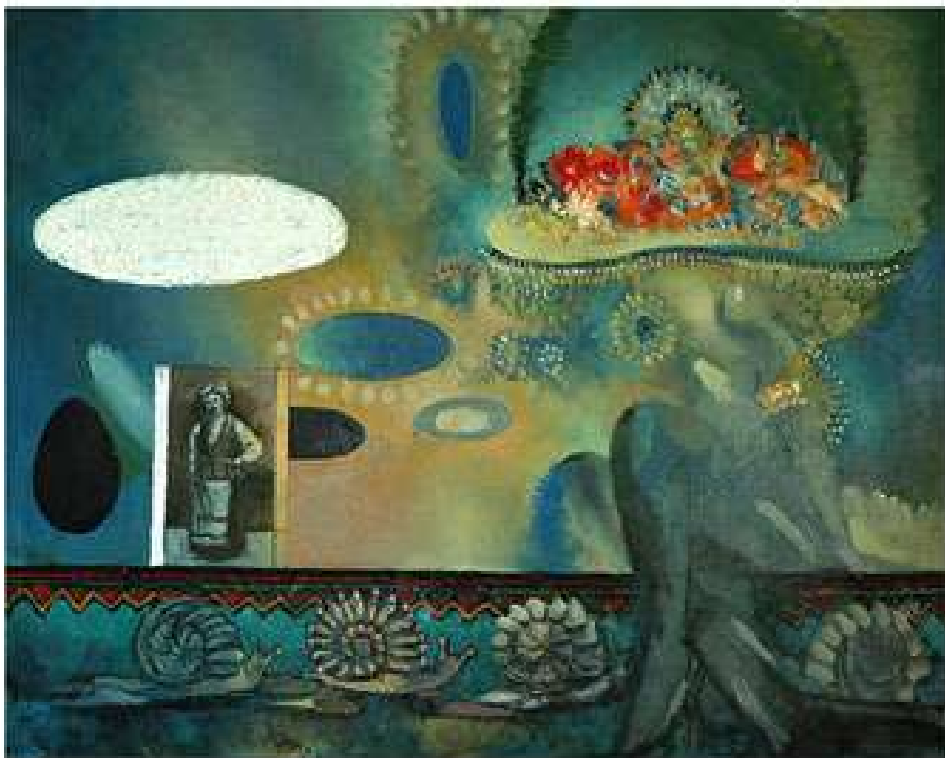
Спалах дитячого хвилювання за чашкою кави або Капелюшок. 1995. Полотно, олія. 75x95.