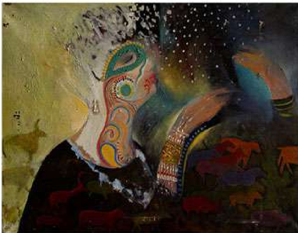
Під знаком Вола, або Єгипетські ночі. 1996. Полотно, олія. 90x115