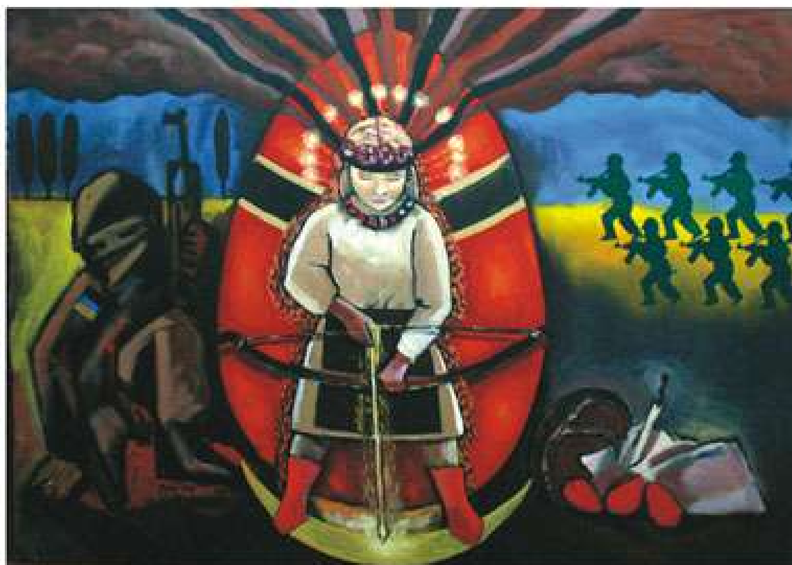
Українська Пасхалія 2014. Народження Сили 2014. Полотно, олія. 86x112 Украинская Пасхалія 2014. Рождение Силы. 2014. Холст, масло. 86x112 Ukrainian Paskhalion 2014. Birth of Force. 2014. Oil on canvas. 86x112