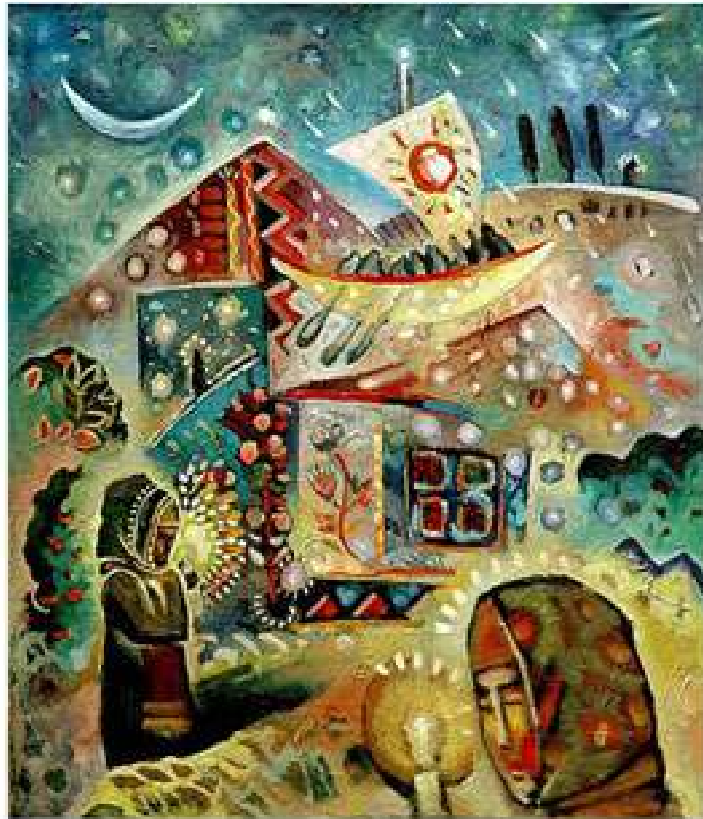
Зоряна хата. 2007. Полотно, олія. 70x60