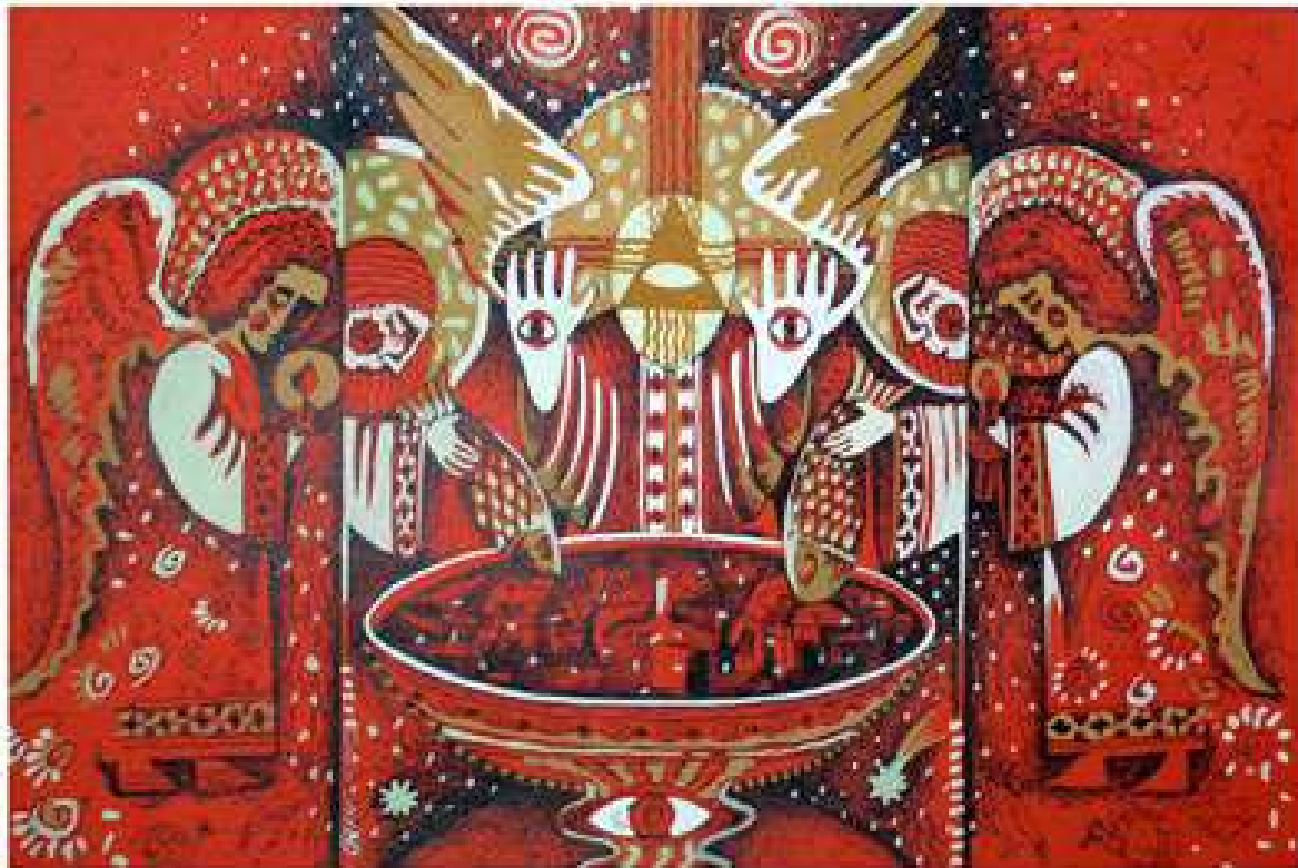
Запускаючи риб. 2003. Кольоровий папір, туш, темпера. 20x30