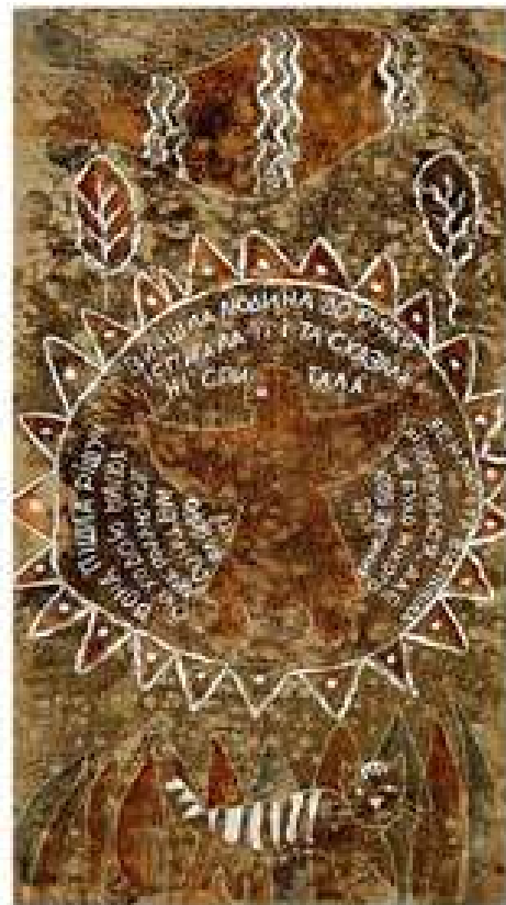
Диптих Легенда про папороть. 1990. Папір, монотіпія. 70x45, 70x45..