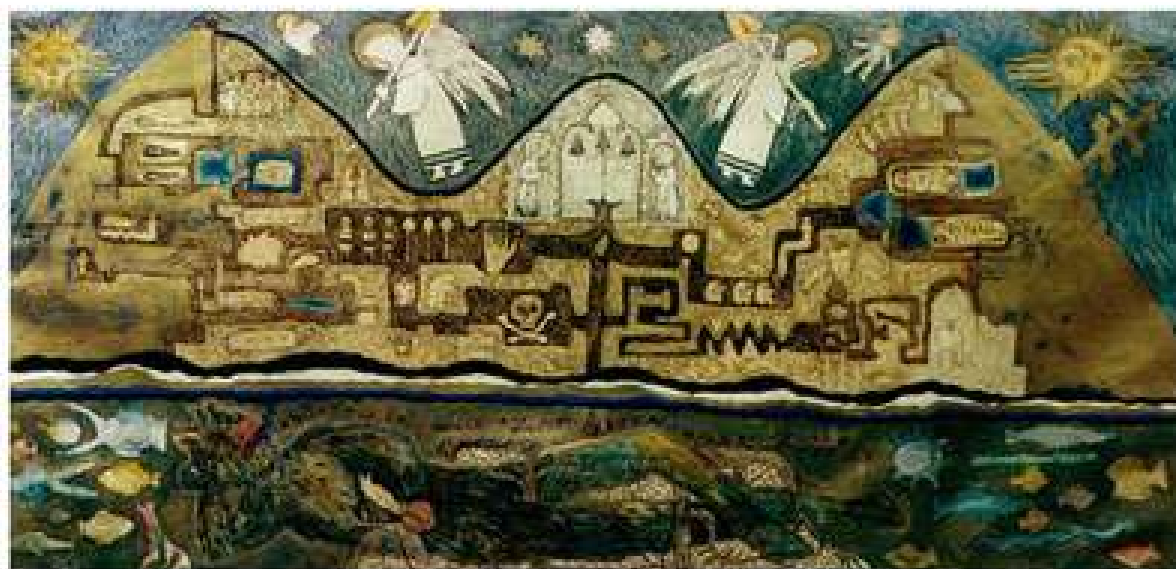
Канівська фієрія. 1989. Папір, авторська техніка. 84x172