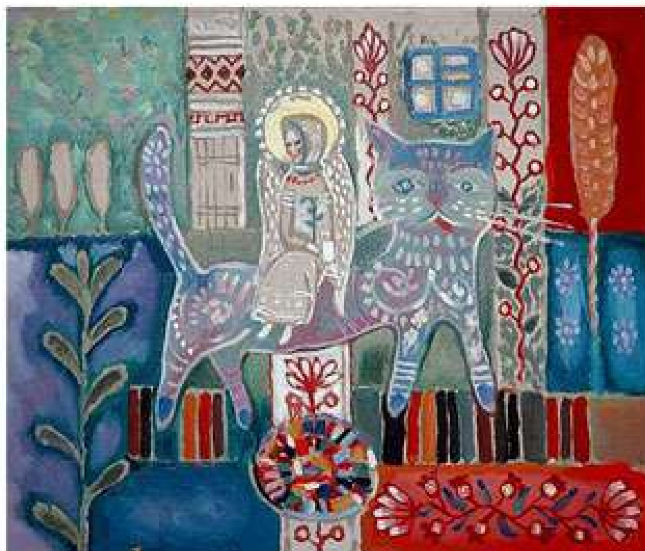
Зелена неділя. 2006. Картон, олія. 55x65