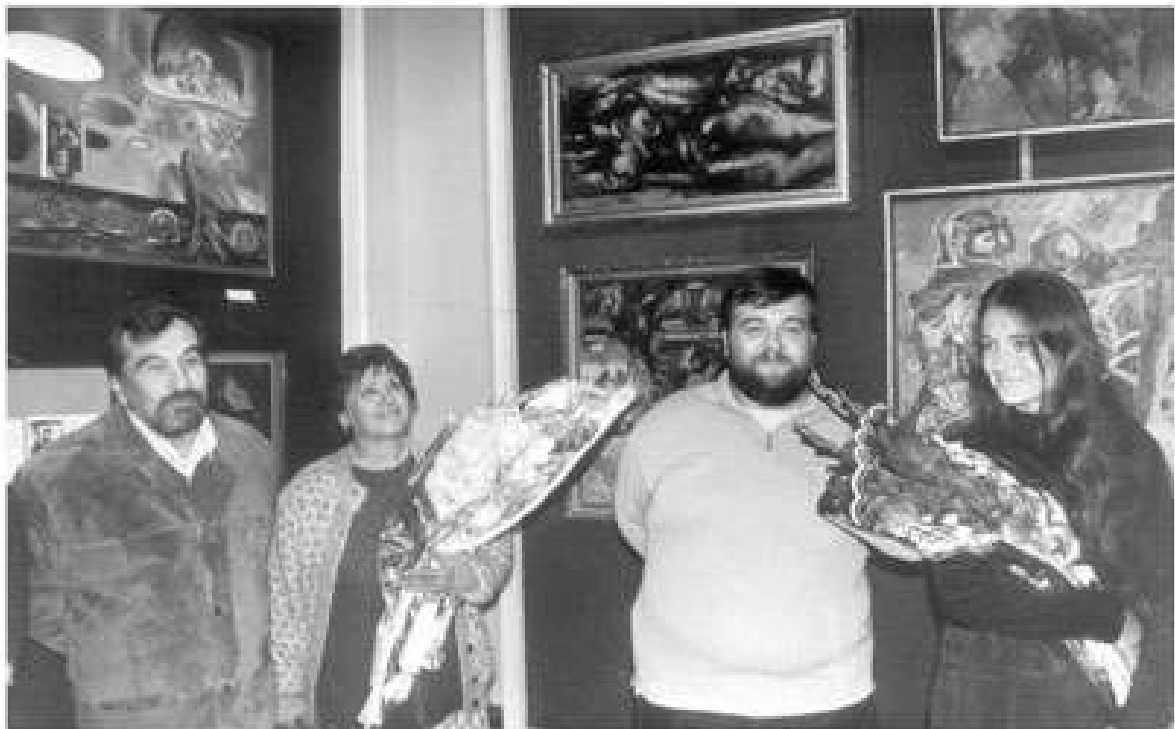
Відкриття виставки родини Надзждіних «Живописні метаморфози» в Черкаському обласному краєзнавчому музеї. 1998р.

«Музеи Украины», газете «Культура и жизнь»), местной прессе.