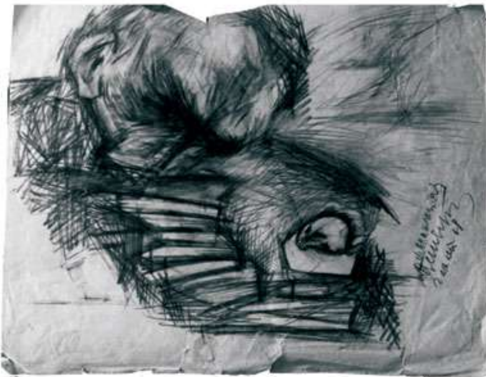
Меланхолія. Гамлет I. 1969. Папір, ретуш. 41x49

-Майстерня – це місце, де я можу вільно реалізовувати свої думки. А такого, щоб робити з майстерні якийсь культовий заклад чи місце для шоу, такого в мене немає. Це місце особисте і зазвичай закрите.