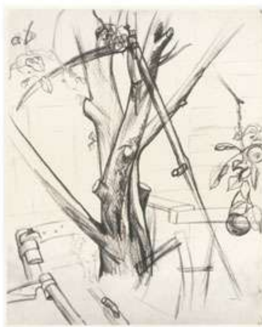
Яблуня. Зарисовка. 1980-і. Папір, олівець. 60x40