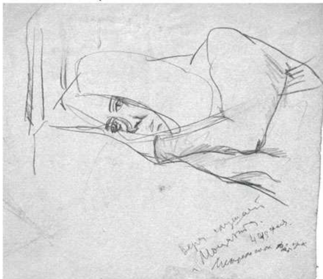
Віра слухає Моцарта. 1962. Папір, вугілля. 45x58

-Краса - це індивідуальне. Ми можемо дивитися на один і той же предмет і ви скажете: «Ой, яка краса!», а я подумаю: «Ну що він там знайшов?». У мистецтві краса і гармонія - це не зовнішні чинники, а цілісне поняття, взаємопроникний зв'язок ідеї, форми виразу і мистецького засобу. Ось я не можу сказати, що «Богоматір Володимирська» чи то пак «Вишгородська» красива. Вона глибоко духовна, вона настільки зачіпає твою душу, що ти приймеш її. Оце, на мій погляд, краса і гармонія, бо наступне за цими поняттями – образ.