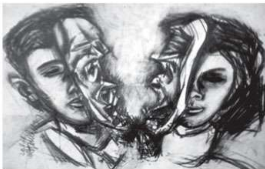
Маски. 1968. Папір, ретуш. 27x40

-Завжди є зовнішній бік справи і внутрішній. На публіку художник може бути і франтом, і позером, і шокуючим та це скоріше елементи соціального захисту. В майстерні біля полотна він відкриває свою душу, але якщо і біля полотна він продовжує грати в «чого ізволіте», тоді він не художник, а просто людина, яка навчилася малювати.