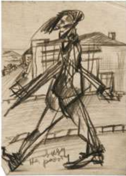
Я іду на роботу. 1960-і. Папір, ретуш. 29x19