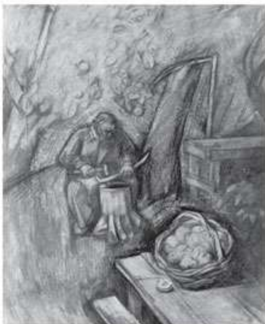
В саду. Початок 1980-х. Папір, ретуш. 60x50

-Природа? Людина - сама природа і тому я дивлюся, що на дерево, що на людину, що на квітку однаково. Ми живемо паралельно. Так само народжуємося, розвиваємося, розквітаємо, даємо плоди, а потім як яблуко – падаємо, переносячи з собою все в якусь іншу субстанцію. Природа - це даність, з якої художник черпає і силу, і слабкості.