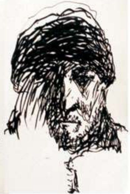
Автопортрет в шапці. 2014 Папір, маркер. 40x29

-Що для Вас питання національного в мистецтві?