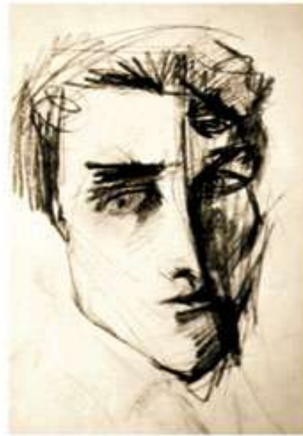
Автопортрет. 1970-і. Папір, ретуш. 45x31