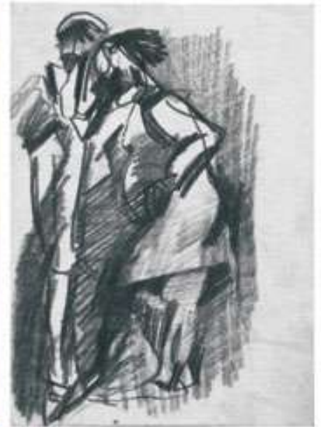
Розмова. 1960-і. Папір, ретуш. 29x19

-Що для Вас є картина і як Ви працюєте над нею? Задум, ескізи чи якимось по-іншому?