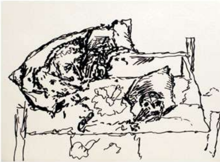
Коліскова. Начерк до картини. 2014. Папір, маркер. 40x60