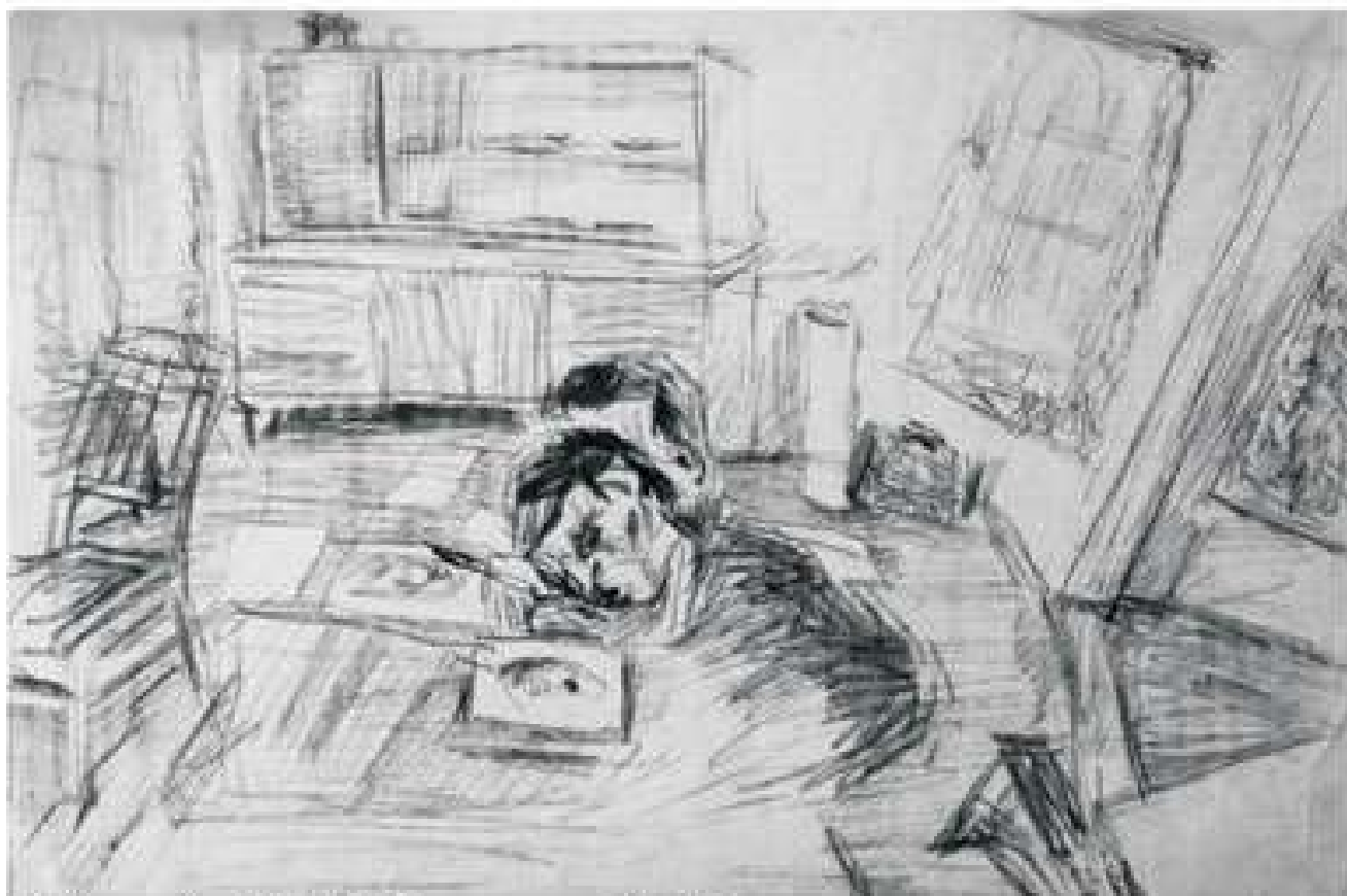
Медитація. 1968. Папір, ретуши. 30x42