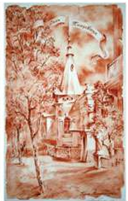
Кліссон. Нотр-Дам. 2003. Папір, олівець. 30x40