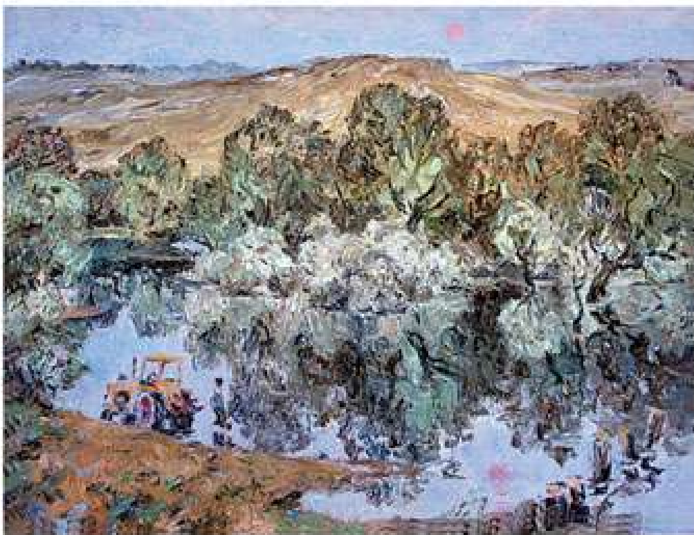
Сутінки. 1983. Полотно, олія. 66x86