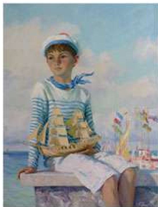
Онук. Луї-Антон. 2010. Полотно, олія. 102x71 Внук. Луи-Антон. 2008. Холст, масло. 102x71 Grandson Louie-Anton. 2008. Oil on canvas. 102x71