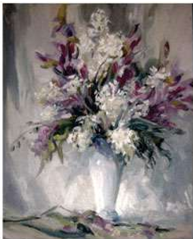
Натюрморт. Ніжність. 2010. Картон, олія. 51x41 Натюрморт. Нежность. 2010. Картон, масло. 51x41 Still life. Tenderness. 2010. Oil on cardboard. 51x41