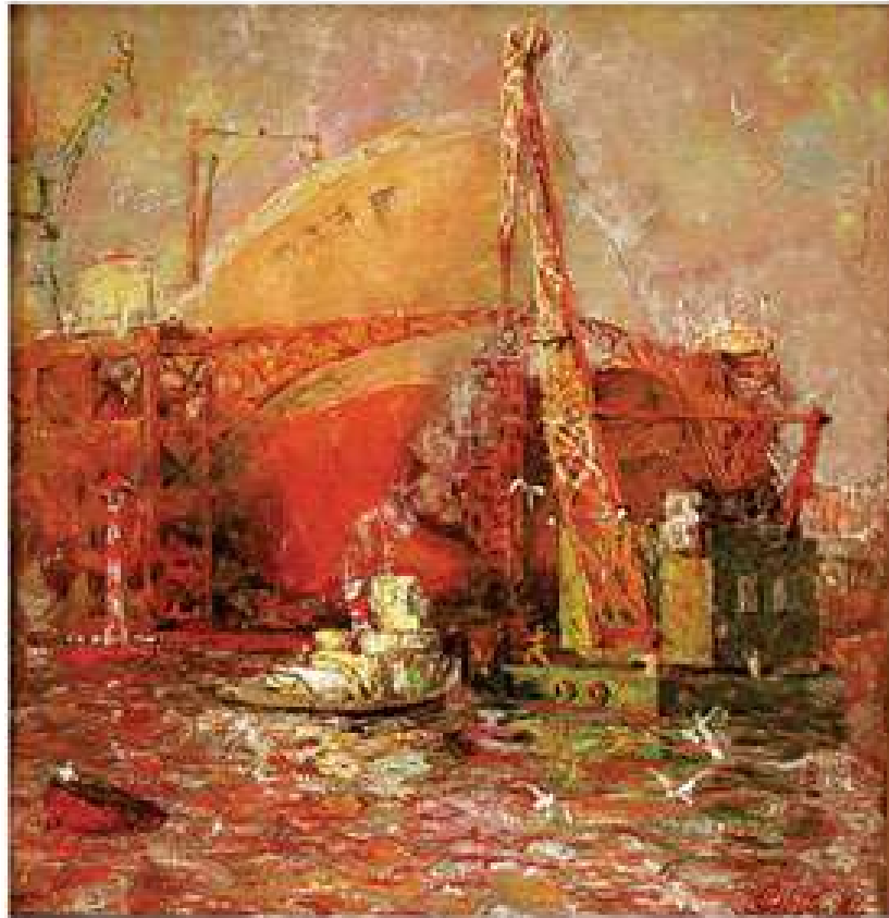
Літній вечір. 1984. Полотно, олія. 73x71