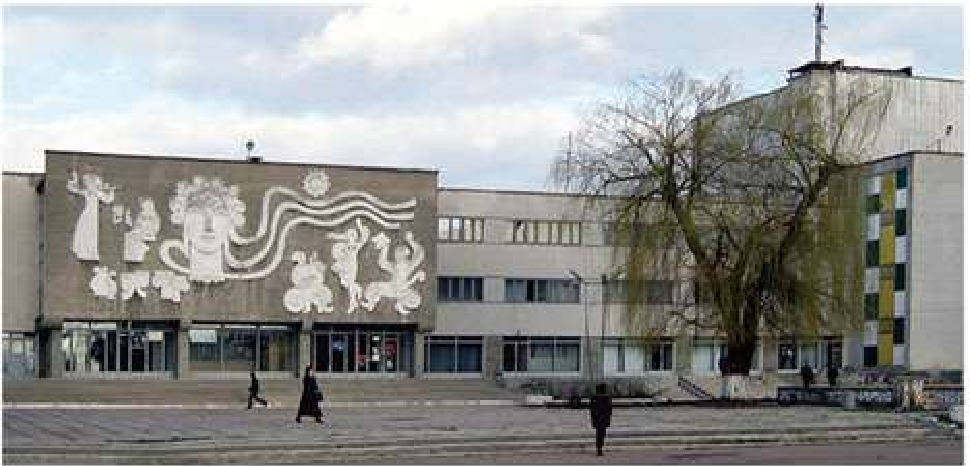
Декоративно-монументальне панно на фасаді будинку культури «Світлопільський», Олександрія, 1975. Декоративно-монументальное панно на фасаде дворца культуры «Светлопольский», Александрия, 1975. Decorative and monumental panel on the façade of Palace of Culture "Svitlopilskii". Oleksandriia, 1975.