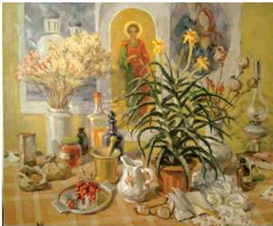
Бабусин стіл. 2018. Полотно, олія. 50x60