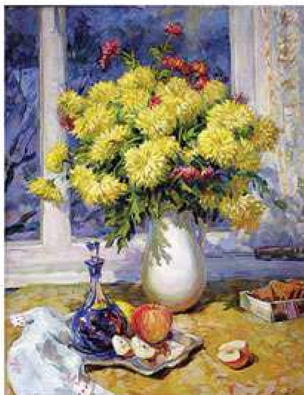
Хризантеми. 2002. Полотно, олія. 66x52