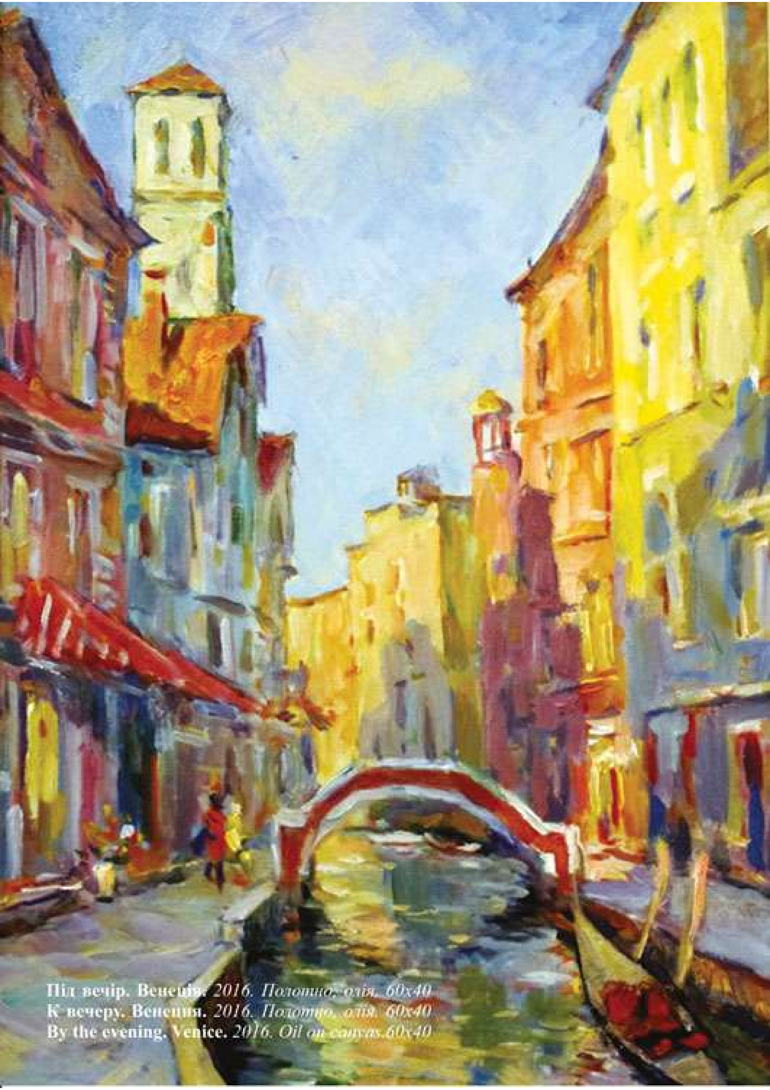
Під вечір. Венеція. 2016. Полотно, олія. 60x40 К вечеру. Венеція. 2016. Полотно, олія. 60x40 By the evening, Venice. 2016. Oil on canvas. 60x40