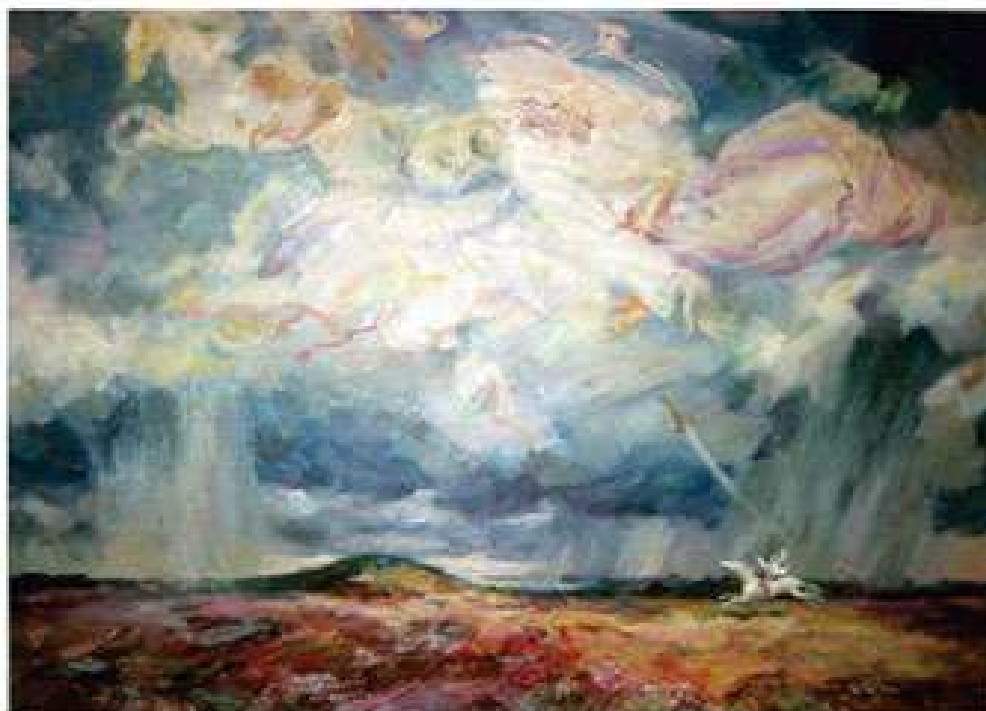
Поклик степу. 1996. Полотно, олія. 100x139