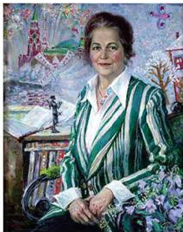
Портрет дружини. 2003. Полотно, олія. 70x56 Портрет жєны. 2003. Холст, масло. 70x56 Wife's portrait. 2003. Oil on canvas. 70x56