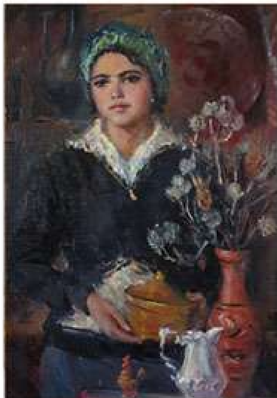
Олена. 1985. Полотно, олія. 69x49