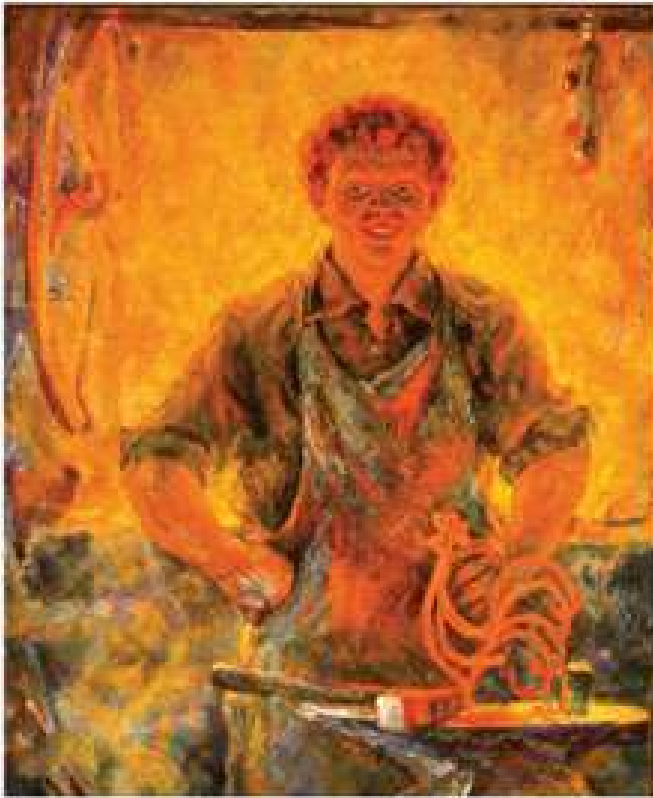
Коваль. 1990. Полотно, олія. 81,5x67