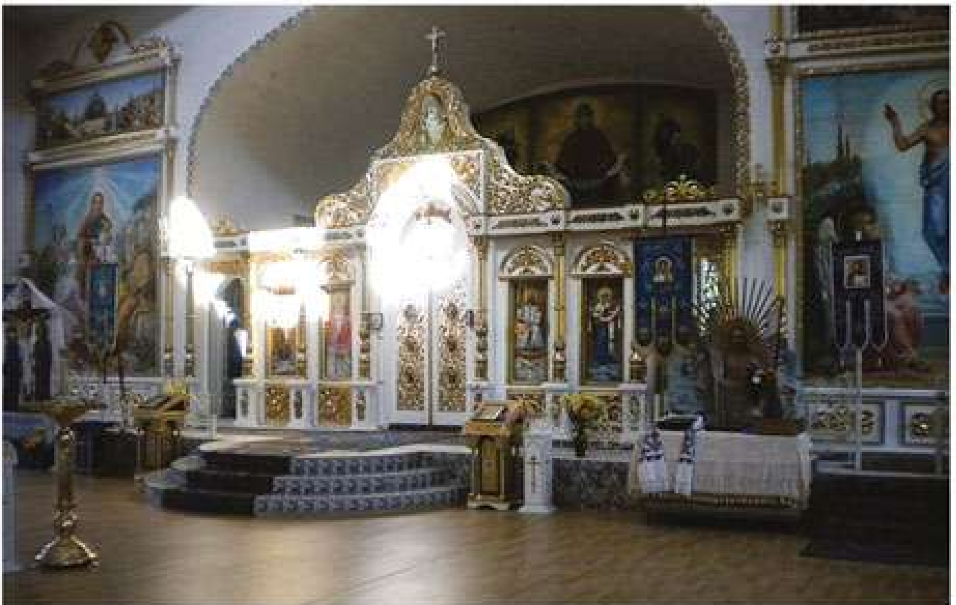
Іконостас Свято-Покровського кафедрального собору в м. Олександрії. Иконостас Свято-Покровского кафедрального собора в г. Александрии. Iconostasis of St.Pokrovskii Cathedral in the town of Oleksandriia.