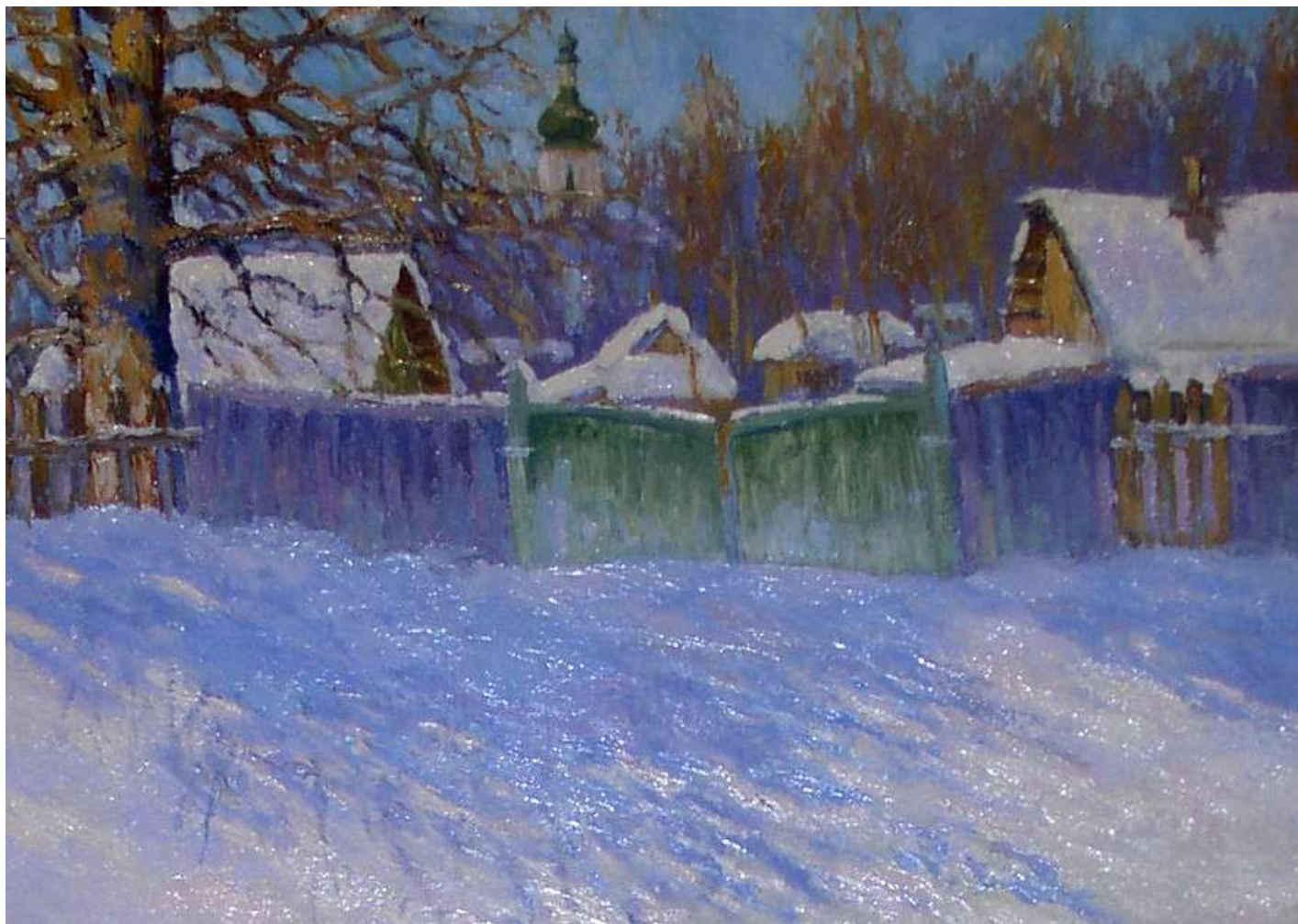
Ранок Седнівського березня. 2004. Полотно, олія. 48x65