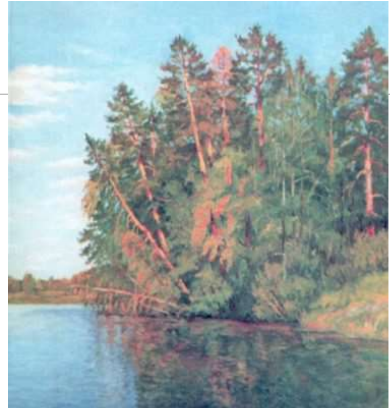
Сосновий берег Полотно, олія

Дуже часто у митця можна побачити добре знайомі і традиційні мотиви, які зазвичай запам'ятовуються, наприклад, мотив звичайного українського села, сільського двору або вулиці, старої церкви або навіть берегу річки та інші