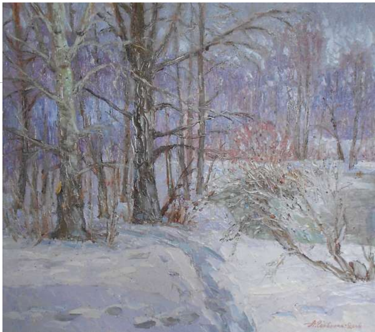
Потепліло. 2004. Картон, олія. 42x47