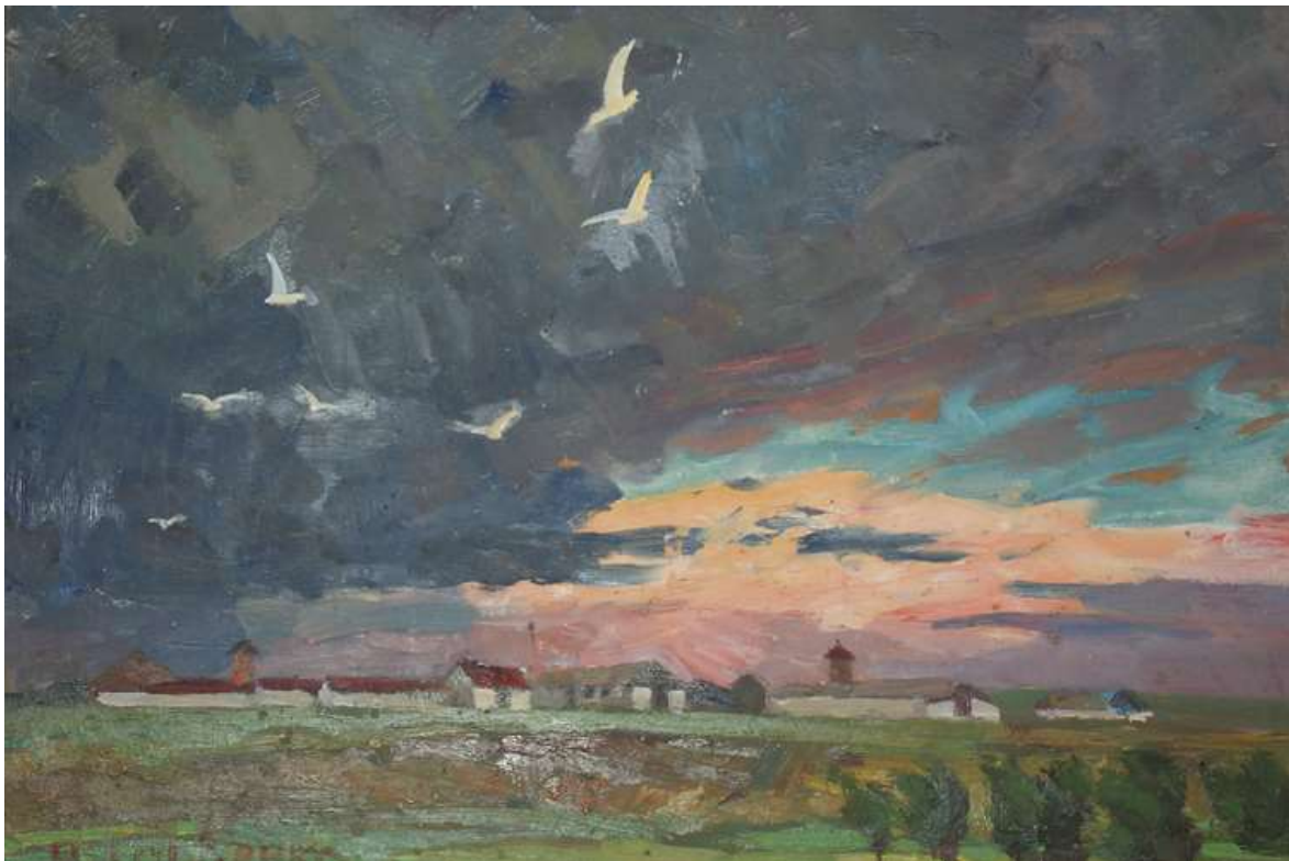
Пейзаж. 1970-і. Картон, олія. 35x50