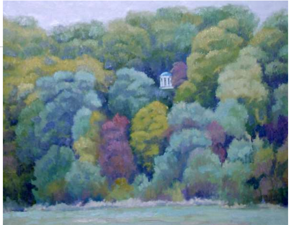
Стоїть гора високая... Глібовська альтанка. 2008. Полотно, олія. 60x75

У відгуках критики, глядачів пейзажні твори А. Горбенка високо оцінюються: "Дивлячись на роботи художника, захоплюєшся його умінням передавати тонкі нюанси багатства природи - легкий смуток похмурого ранку, тонкість і різноманіття відтінків дощового дня, таємничість мрячного вечірнього спокою. Жодна робота не схожа по кольору, немає заучених фарб, що переходять з полотна на полотно. Роботи Анатолія перейняті глибокою щирістю, переконаністю, любов'ю до природи і до людей" (кінооператор В. Безсмертний) [1]