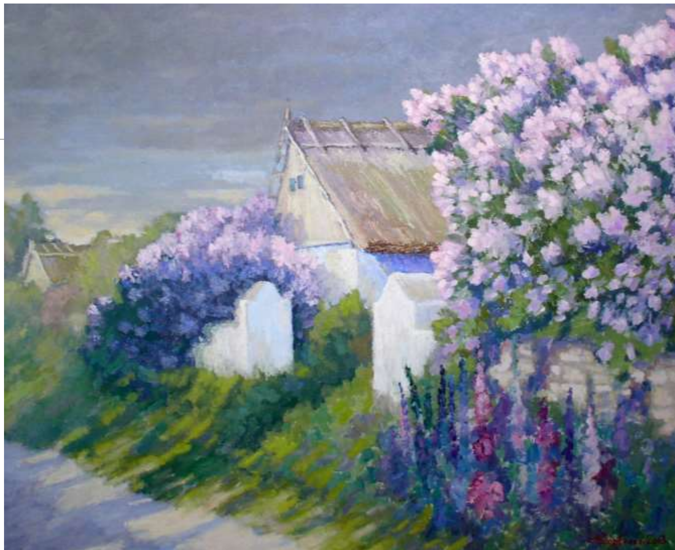
Після дощу. 2013. Полотно, олія. 86x106