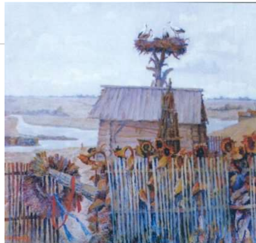
Біля рідного дому Полотно, олія

Художник висвітлює бездоганну красу самих звичайних, повсякденних і скромних пейзажних видів, які набувають у його творах поетичного або ліричного характеру