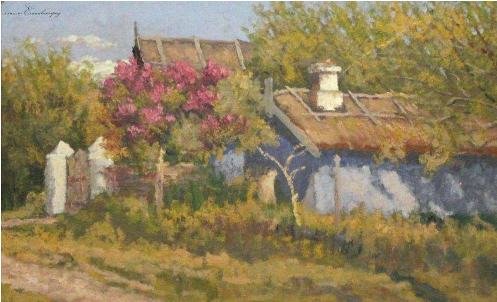
Сільська вулиця. Полотно, олія