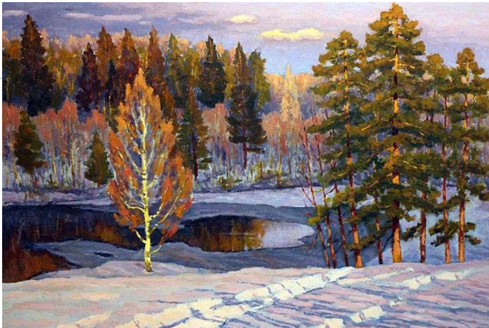
Зимовий пейзаж. Полотно, олія