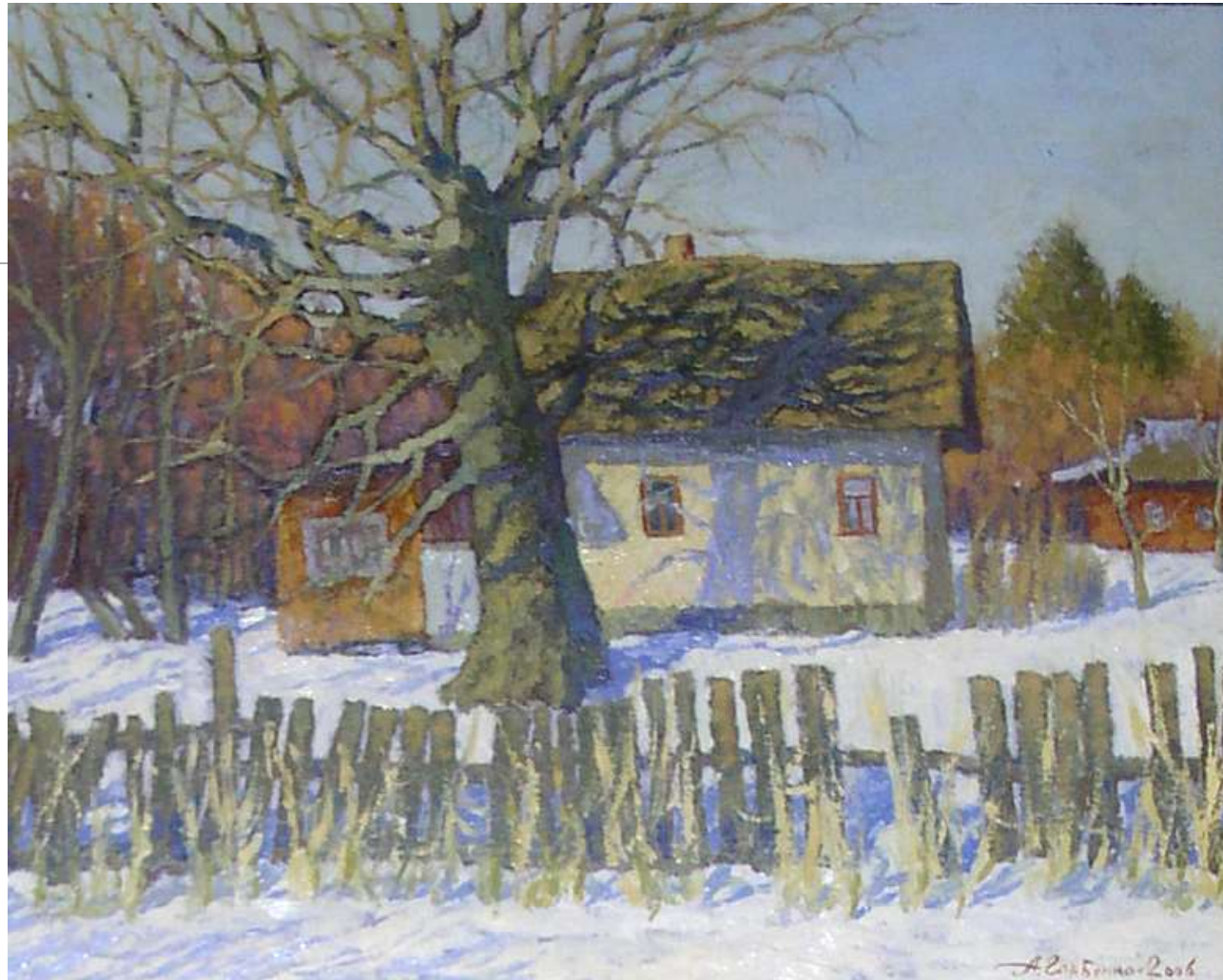
Будинок на узліссі. 2006. Картон, олія. 50х61