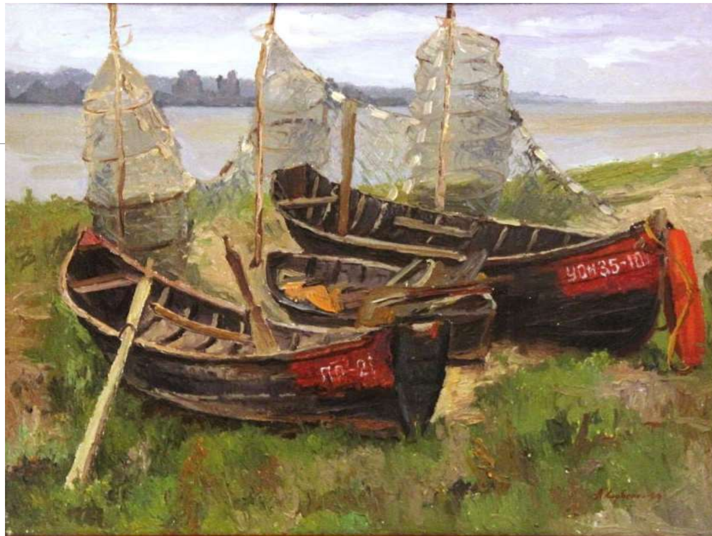
Баркаси на березі Дністра. Полотно, олія