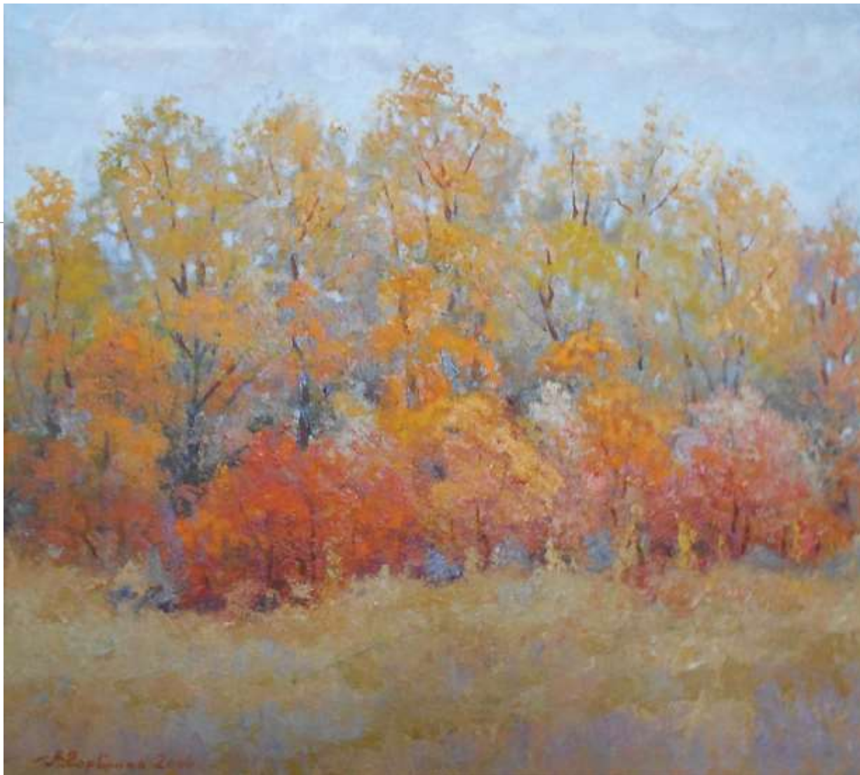
Золотий куточок. 2006. Картон, олія. 47х53