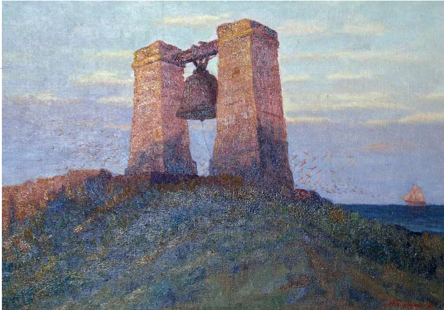
Херсонський символ. 1999. Полотно, олія. 50x70