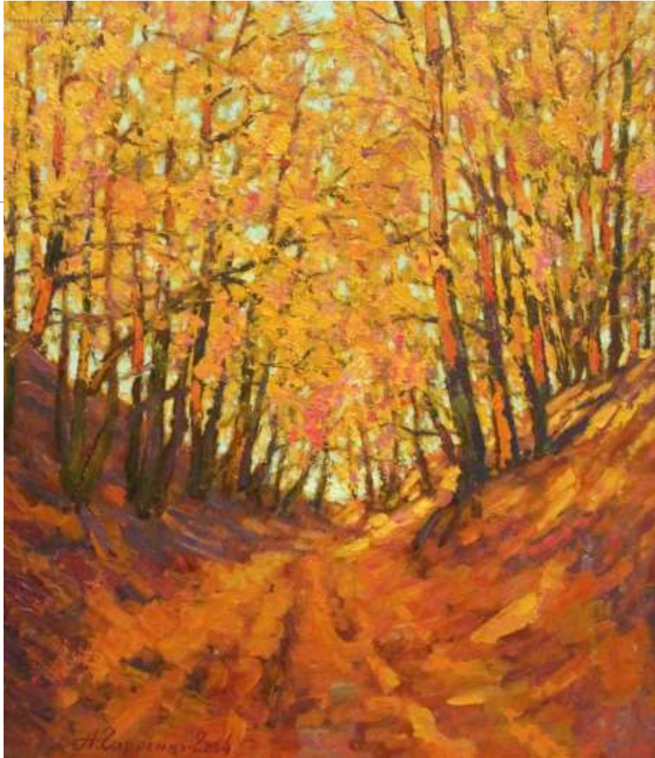
Седнівська золота алея