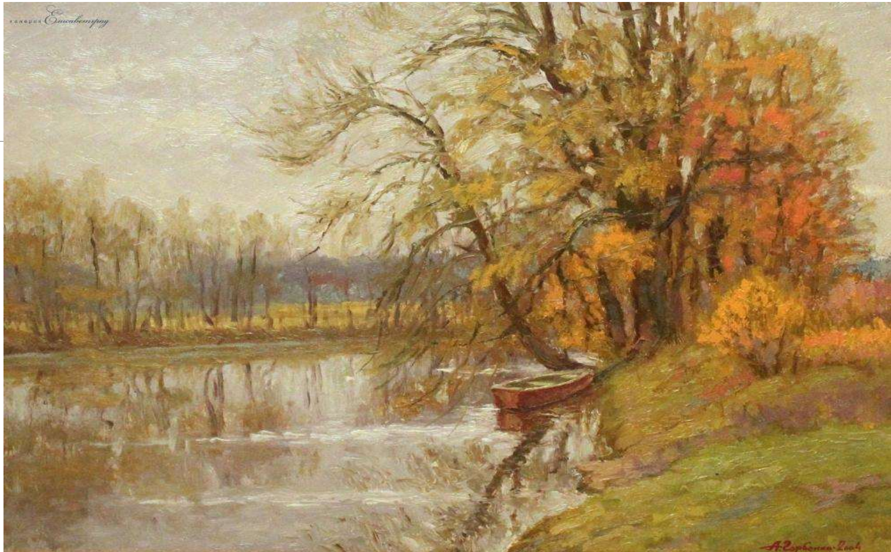
Осінь закінчується. Полотно, олія