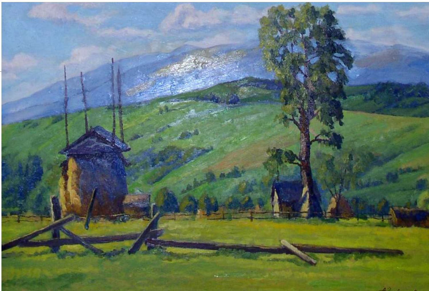
Долина під Раховим. 2006. Картон, олія. 52x76