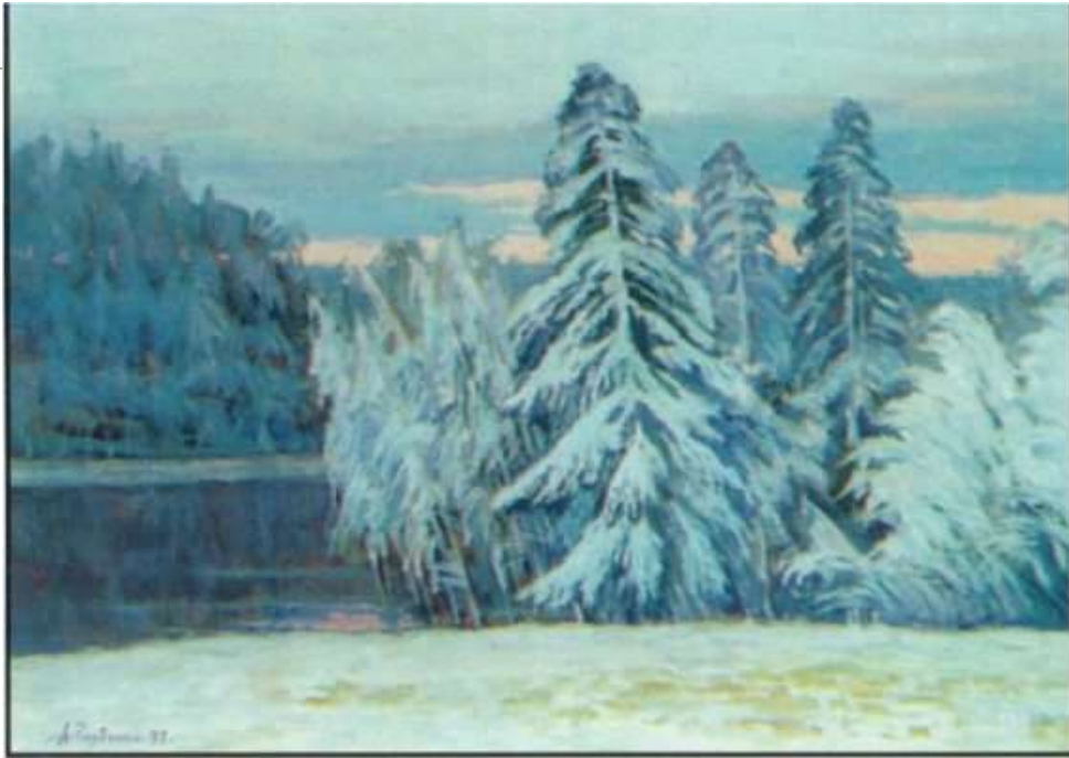
Травневий снігопад. Полотно, олія

У пейзажах А. Горбенко не намагається відобразити лише зовнішню красу природи, скоріше він прагне відобразити і розкривати її внутрішню красу, яка повинна викликати відповідні почуття, в залежності від того, що він зобразив