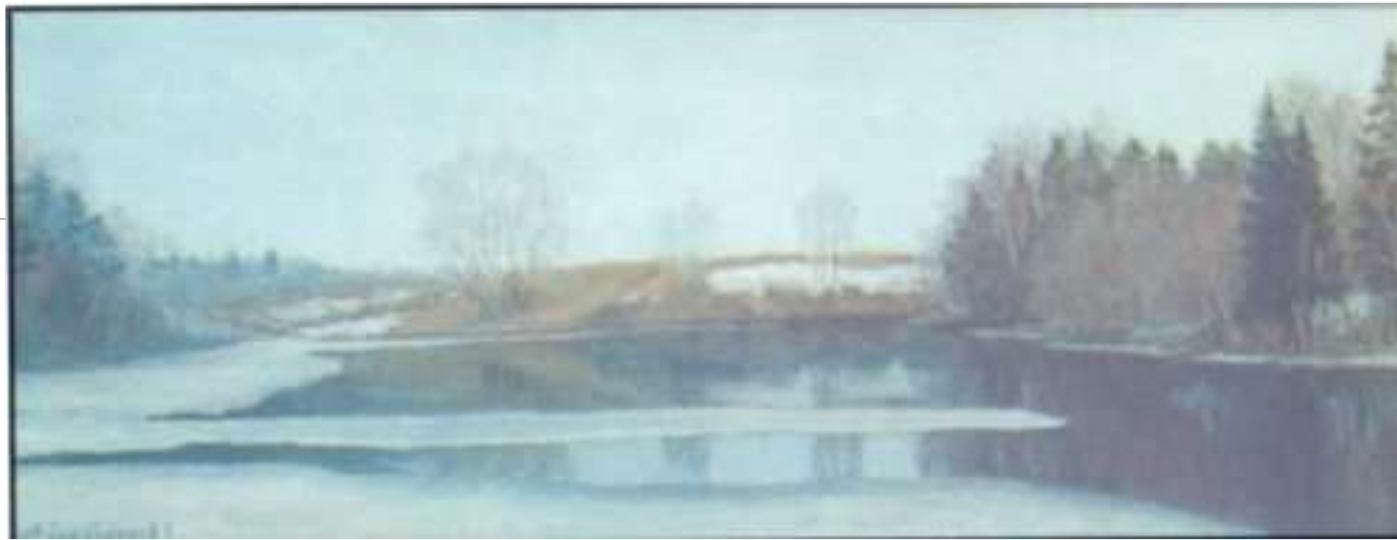
Розлив. Полотно, олія

Мистецтво будь-якого художника визначається його мальовничим баченням світу, а це бачення буває дуже різноманітним - зірким, проникливим, напруженим, спокійним чи навіть байдужим. Говорячи про творче бачення Анатолія Олександровича, можна сказати, що його твори викликають довірливі почуття, а його мистецтво сприймається як поетично одухотворене