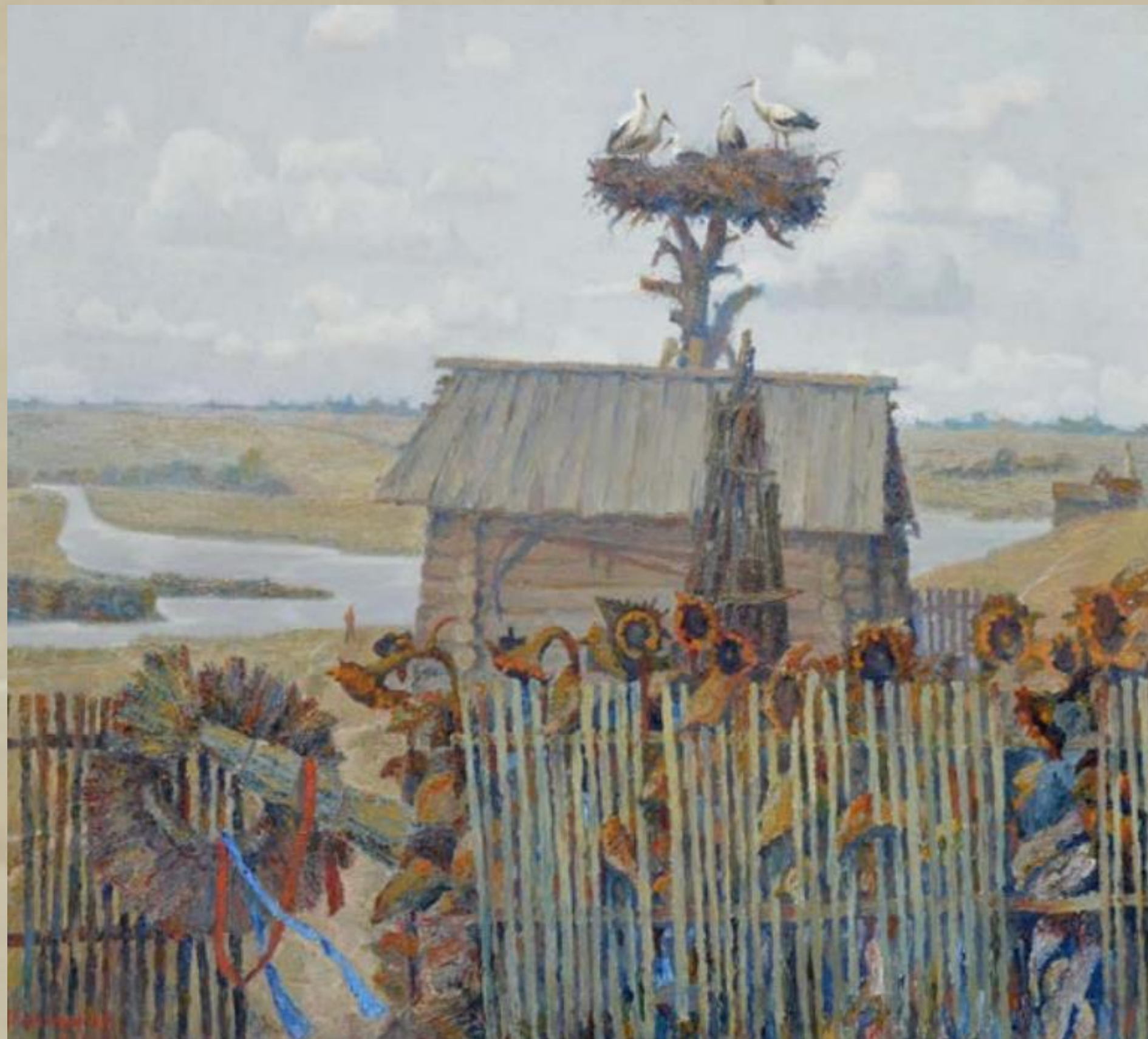
Лелеки. Біля рідного дому. Центральна частина триптиха «Моя Кіровоградщина»