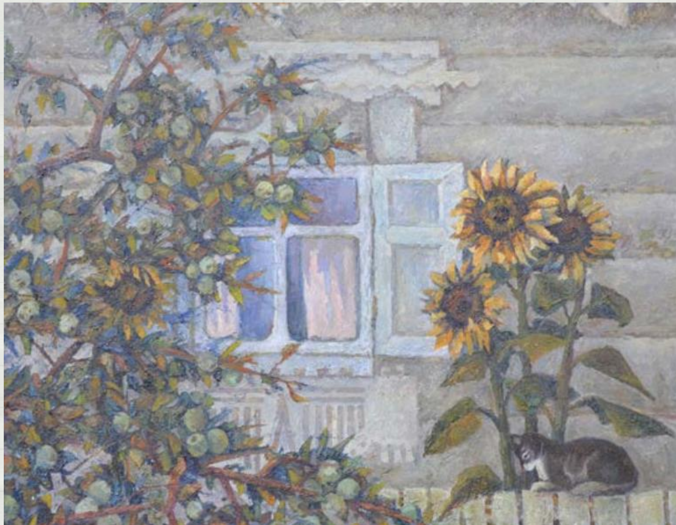
Рідні місця. Ліва частина триптиха «Моя Кіровоградщина»