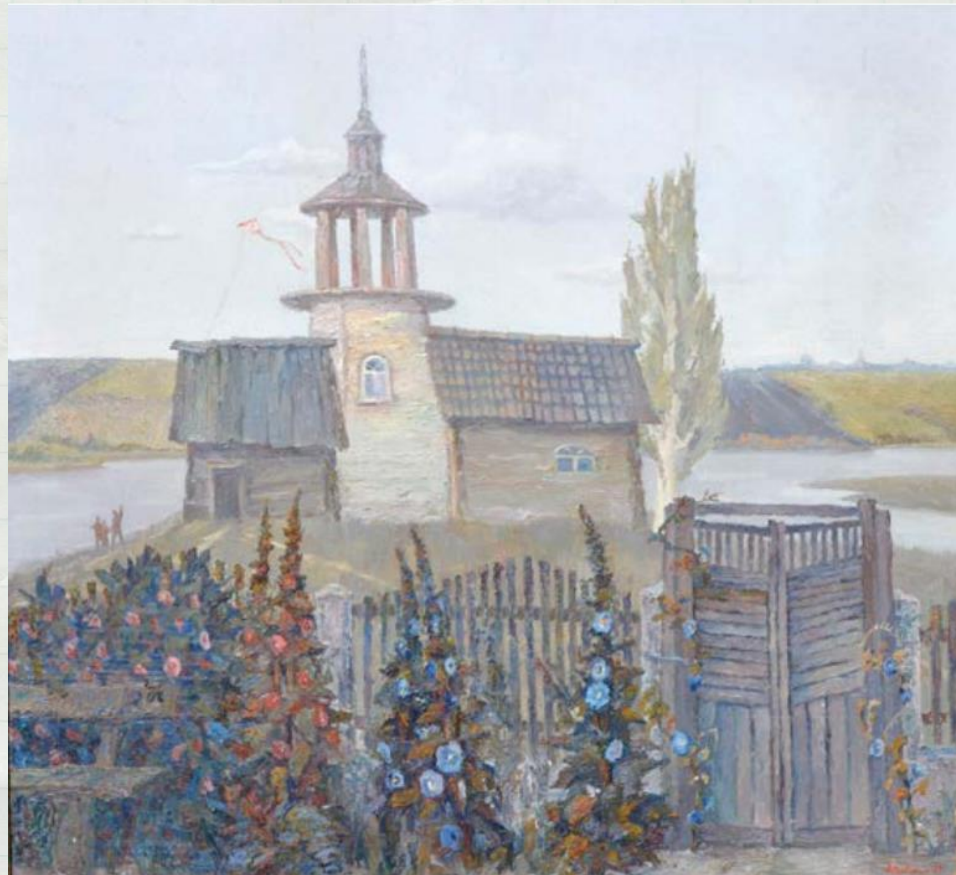
Моя Кіровоградщина. Права частина триптиха «Моя Кіровоградщина»