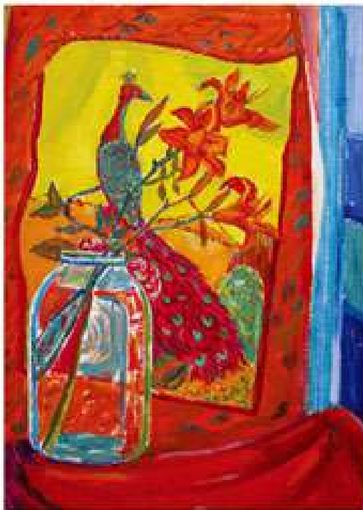
Лілеї. 2004. Полотно, олія. 60x50