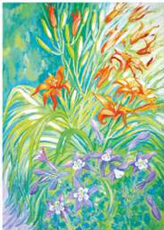
Ранок. 2017. Картон, темпера. 70x50