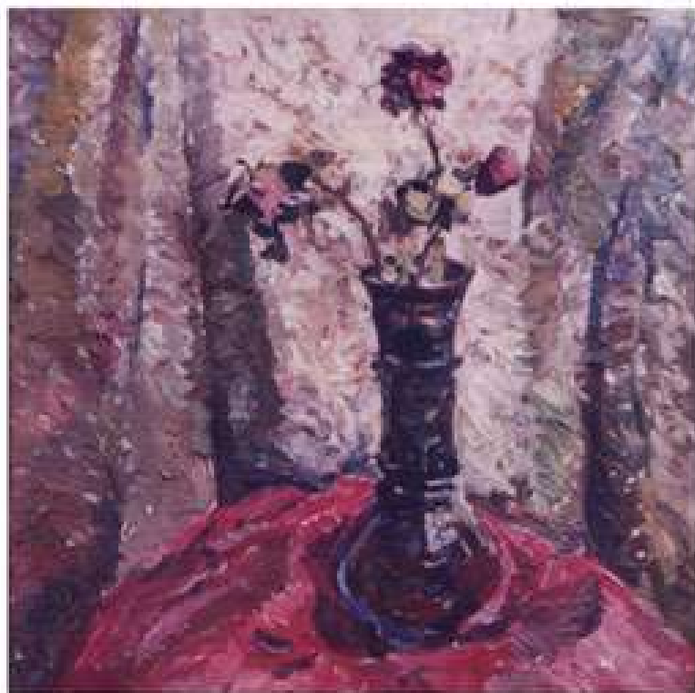
Зів'ялі троянди. 1995. Полотно, олія. 50x50