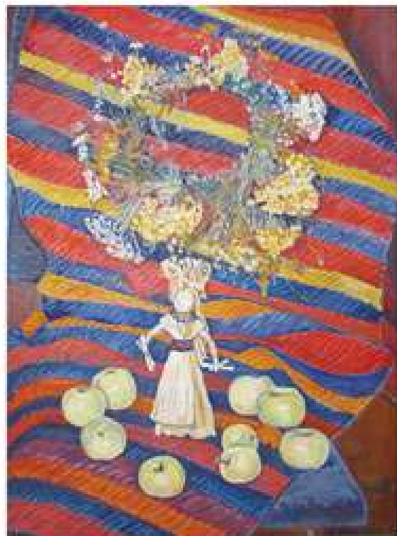
Берегиня. 2013. Полотно, олія. 80x60