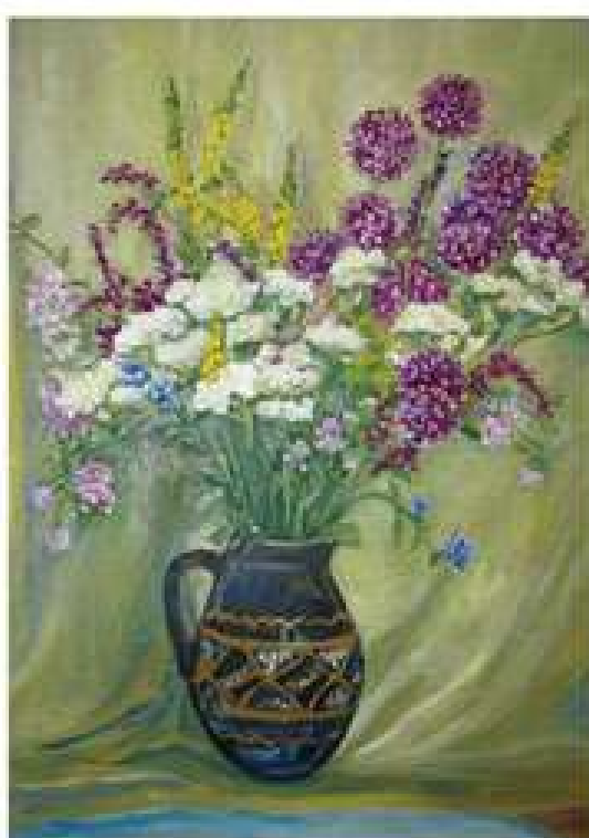
Квіти. 2012. Картон, олія. 70x50