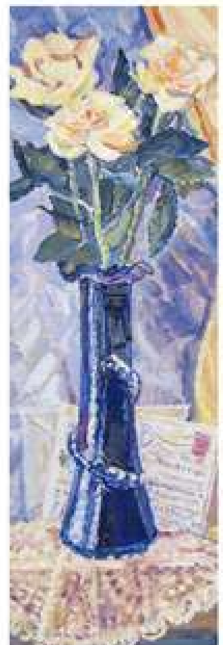
Старі листи. 2013. Полотно, олія. 60x21