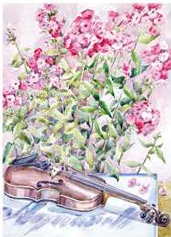
Скрипка і квіти. 2004. Папір, акварель. 56x40