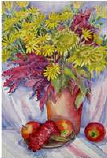
Ярова-Вінтенко Г.Г. Амарант. 2017. Папір, акварель. 55x36