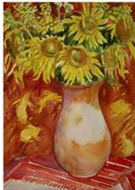
Ярова-Вінтенко Г.Г. Сонячні зайчики. 2008. Папір, акварель. 44x32