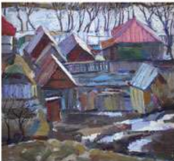
Вінтенко Ю.Б. Початок весни. 1978. Полотно, олія. 60x65

Ю. - Але великі художники, при цьому всьому, залишалися самі собою, а не «чого изволите». Нам з Галею те, що ми працюємо в системі мистецької освіти, дозволяє працювати, творити, не будучи залежним від системи арт-бізнесу.