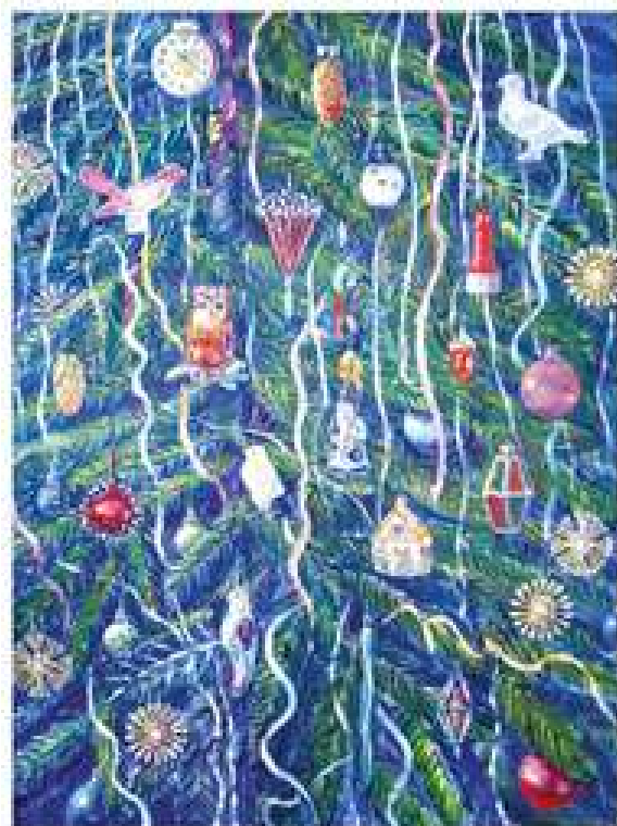
Ялинка для Михайлика. 2017. Полотно, олія. 80x60