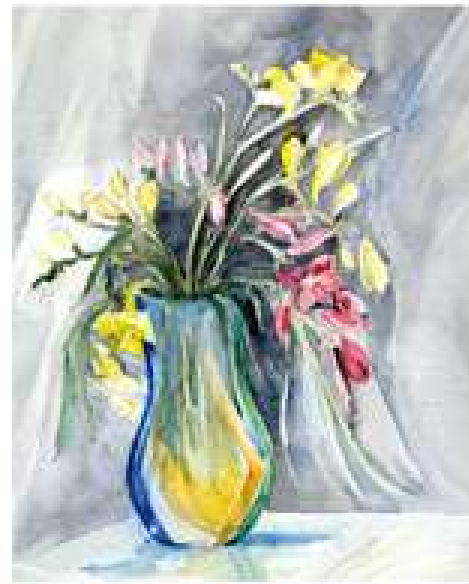
Ярова-Вінтенко Г.Г. Фрезії. 2010. Папір, акварель. 42x34

Наскільки кінцевий результат твору співпадає з задумом і як часто Вас влаштовує створене?