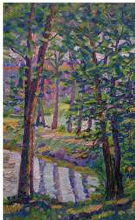
Біля ставу. 2005. Полотно, олія. 55x34