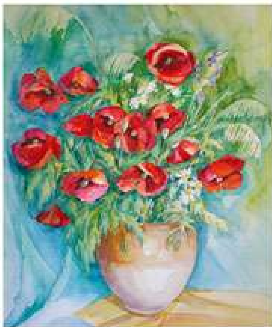
Ярова-Вінтенко Г.Г. Маки. 2006. Папір, акварель. 60x49

Г. - Взагалі, думаю мистецький образ зрозумілий тим, хто мистецтвом переймається, або пробує щось творити сам. В дитинстві я думала, якщо художник вмів малювати, то він взяв, раз-два і намалював, але ж він чомусь малює і перемальовує, мастихіном зтирає, тож він не задоволений, шукає образ.