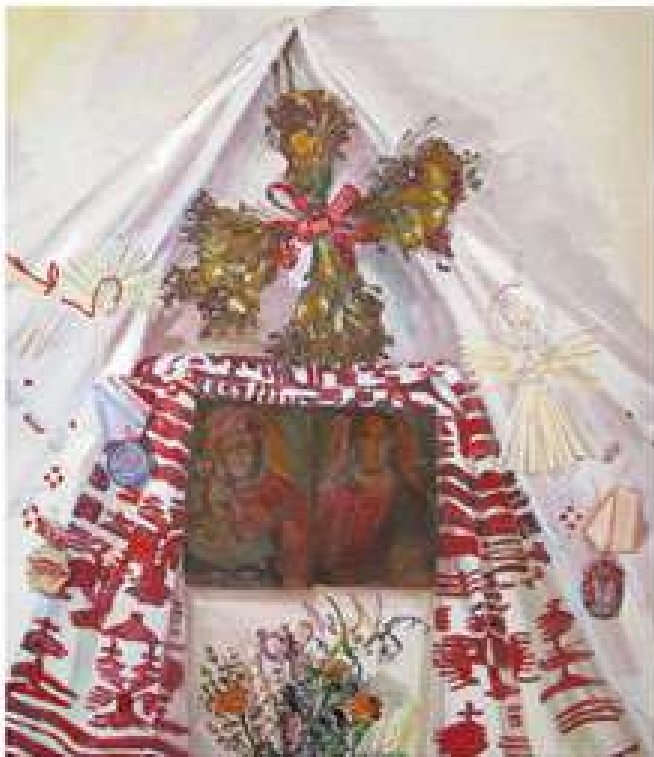
Натюрморт з оберегами. 2008. Полотно, олія. 70x60