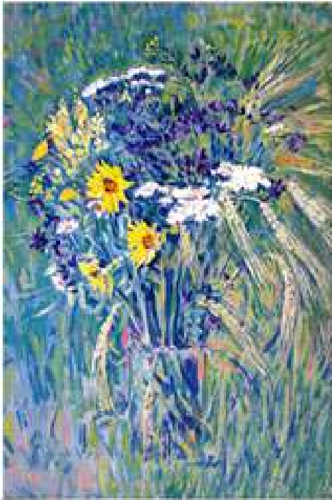
Літні трави. 2003. Полотно, олія. 69x49