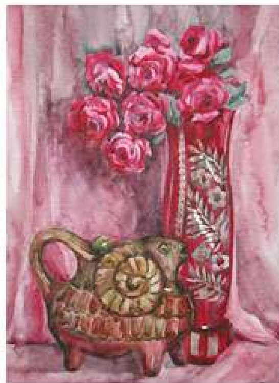
Баранець та троянди. 2007. Папір, акварель. 51x38