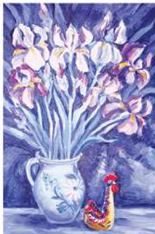
Півники. 2017. Полотно, олія. 60x40