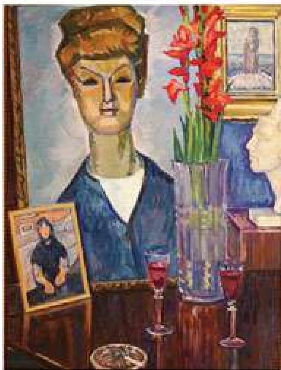
Незакінчена розмова 2012. Картон, олія. 79x59,5