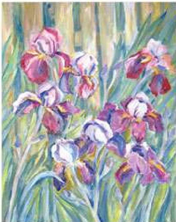
У квітнику. 2012. Полотно, олія. 50x40