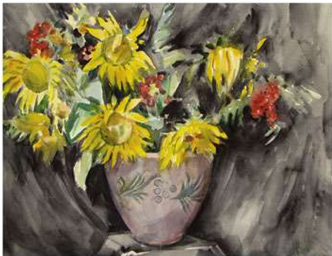
Соняшники та горобина. 2006. Папір, акварель. 49x64