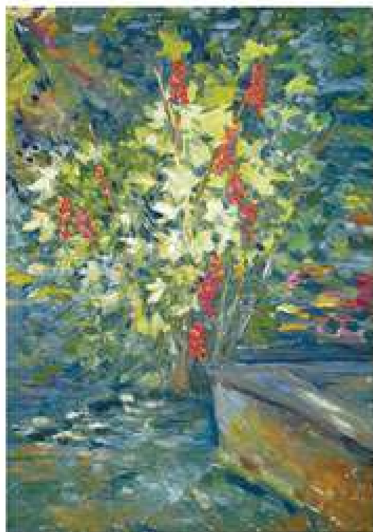
Старий куц. 2003 Полотно, олія. 70x50