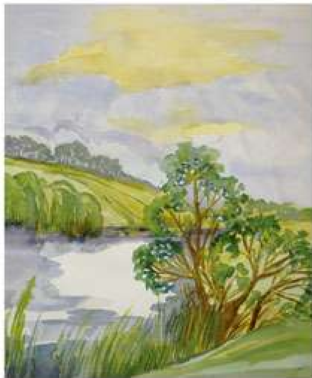
Після дощу. 2017. Папір, акварель. 55x45