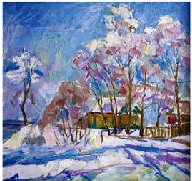
Віснь. 1980. Полотно, олія. 60x65