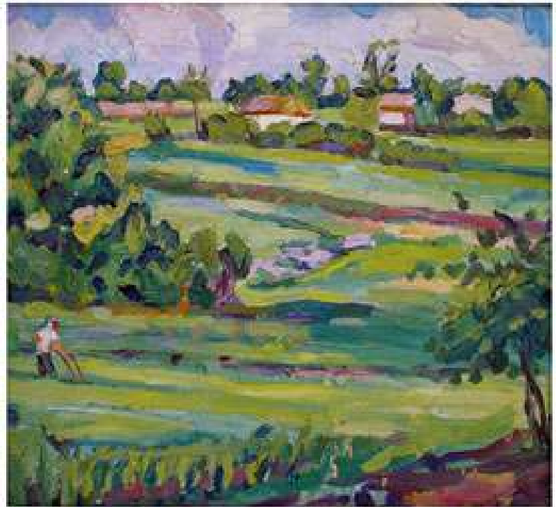
Пейзаж з дідом Гришею. 1995. Полотно, олія. 38x46