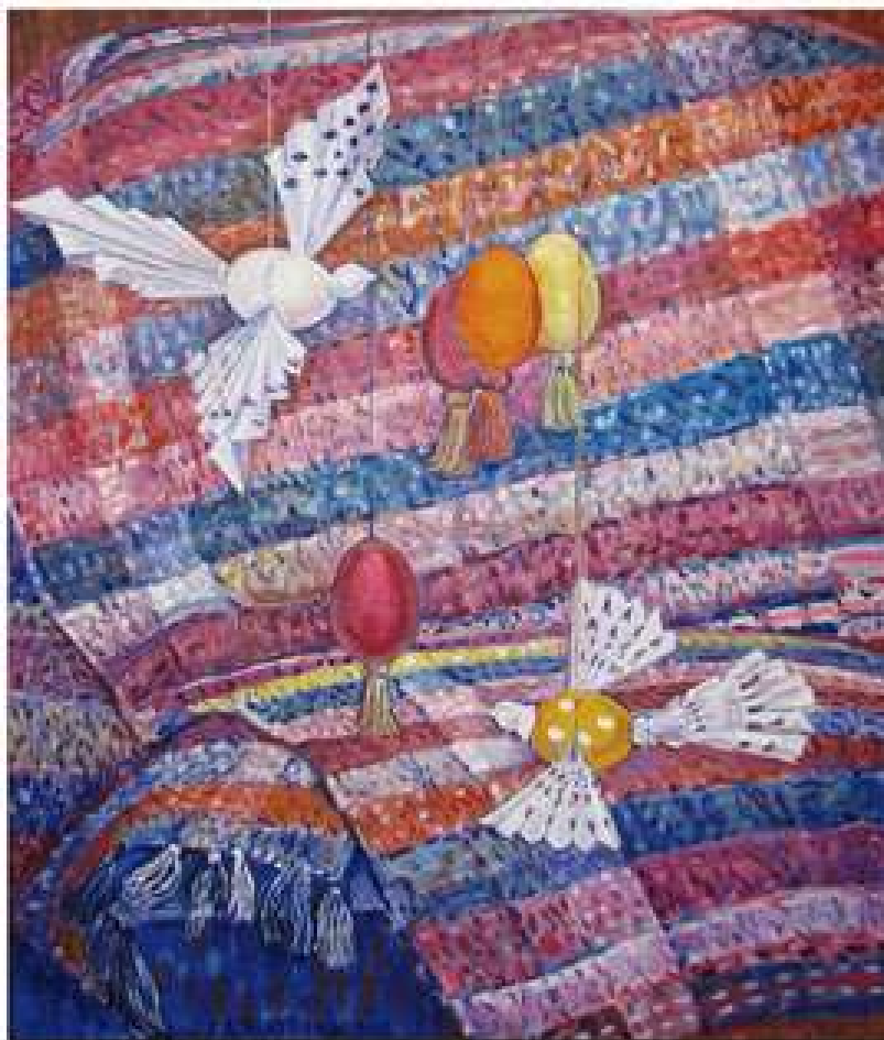
Голуби та дзвони. 2012. Полотно, олія. 80x60

НАРОДИВСЯ 1955 Р. В М. ХАРКОВІ. ЗАКІНЧИВ КРИМСЬКЕ ДЕРЖАВНЕ ХУДОЖНЄ УЧИЛИЩЕ ІМ. М.АМОНИША(1975). ПЕДАГОГ З ФАХУ. В.ГРИГОР'ЄВ, М.МОРГУЦ, П.ЛАСЕНКО. ЧЛЕН НАЦІОНАЛЬНОЇ (СПІЛКИ ХУДОЖНИКІВ УКРАЇНИ(1990). ЖИВОПИСЕЦЬ. З 1994 Р. ПРАЦЮЄ В КІРОВОГРАДСЬКІЙ ДІТЯЧІЙ ШКОЛІ МИСТЕЦТВА НА ПОСАДІ ЗАВДУВАЧА ВІДДІЛОМ ОБРАЗОТВОРЧОГО МИСТЕЦТВА. УЧАСНИК ВСЕУКРАЇНСЬКИХ ХУДОЖНІХ ВИСТАВОК. ТВОРИ ЗБЕРІГАЮТЬСЯ В МУЗЕЯХ, ПРИВАТНИХ КОЛЕКЦІЯХ В УКРАЇНІ ТА ЗАКОРДОНОМ.