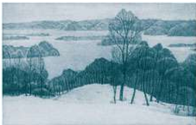
Вінтенко Ю.Б. Над зимовим Сномом. 1980. Офорт. 15x23