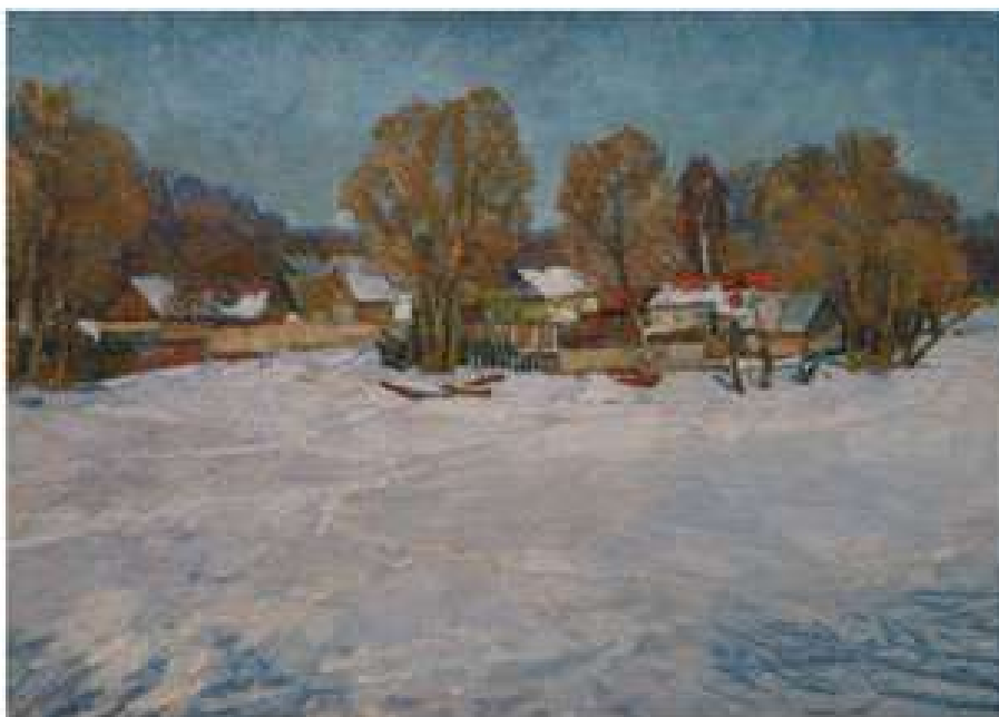
Вінтенко Ю.Б. Зимовий день. 1986. Полотно, олія. 60x90