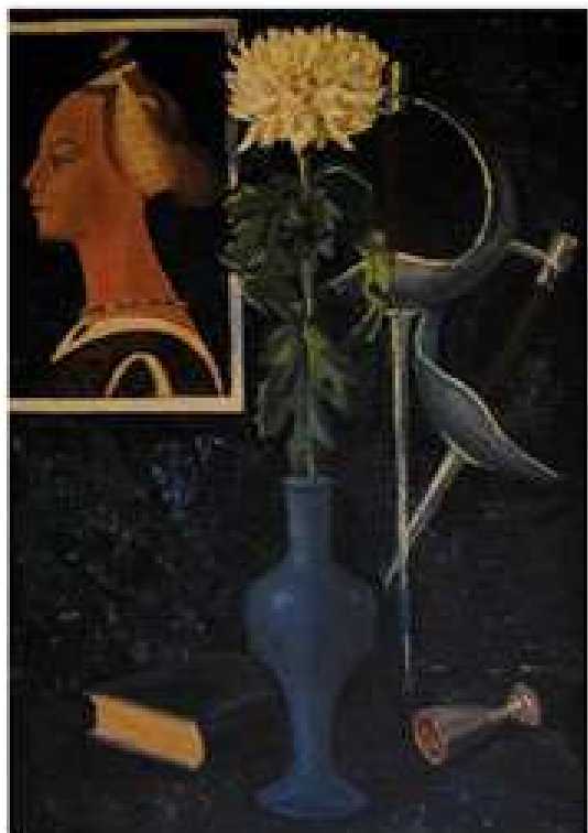
Навіяне Шекспіром. 1972. Полотно, олія. 70x50