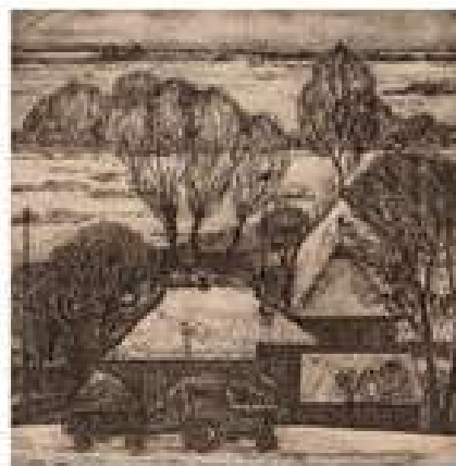
Вінтенко Ю.Б. Зимовий вечір. 1980. Офорт. 13x14

Ви кажете - «інші художники стали своєрідними маяками для мене», цікаво дізнатися імена.