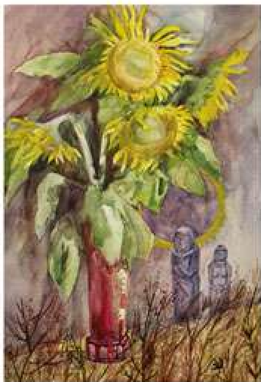
Сонячне затемнення. 2006. Папір, акварель. 69x47