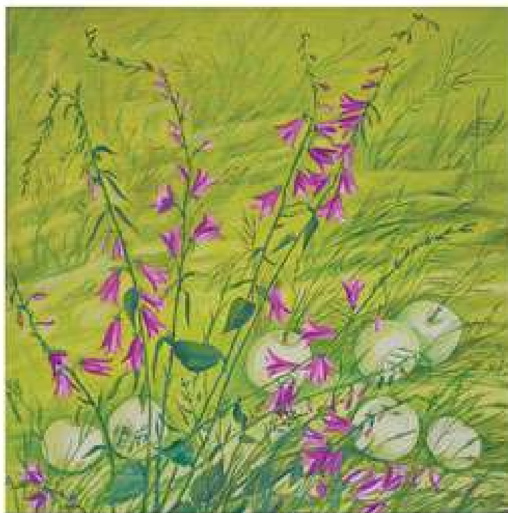
Білий налив. 2003. Картон, темпера. 50x50