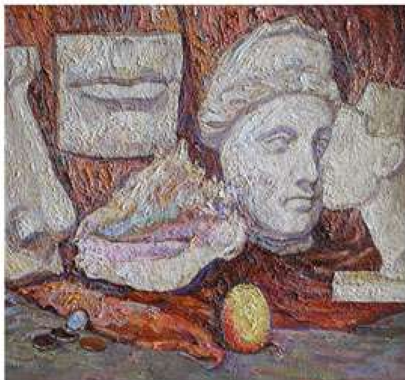
Муляжі. 1996-1997. Полотно, олія. 45x55