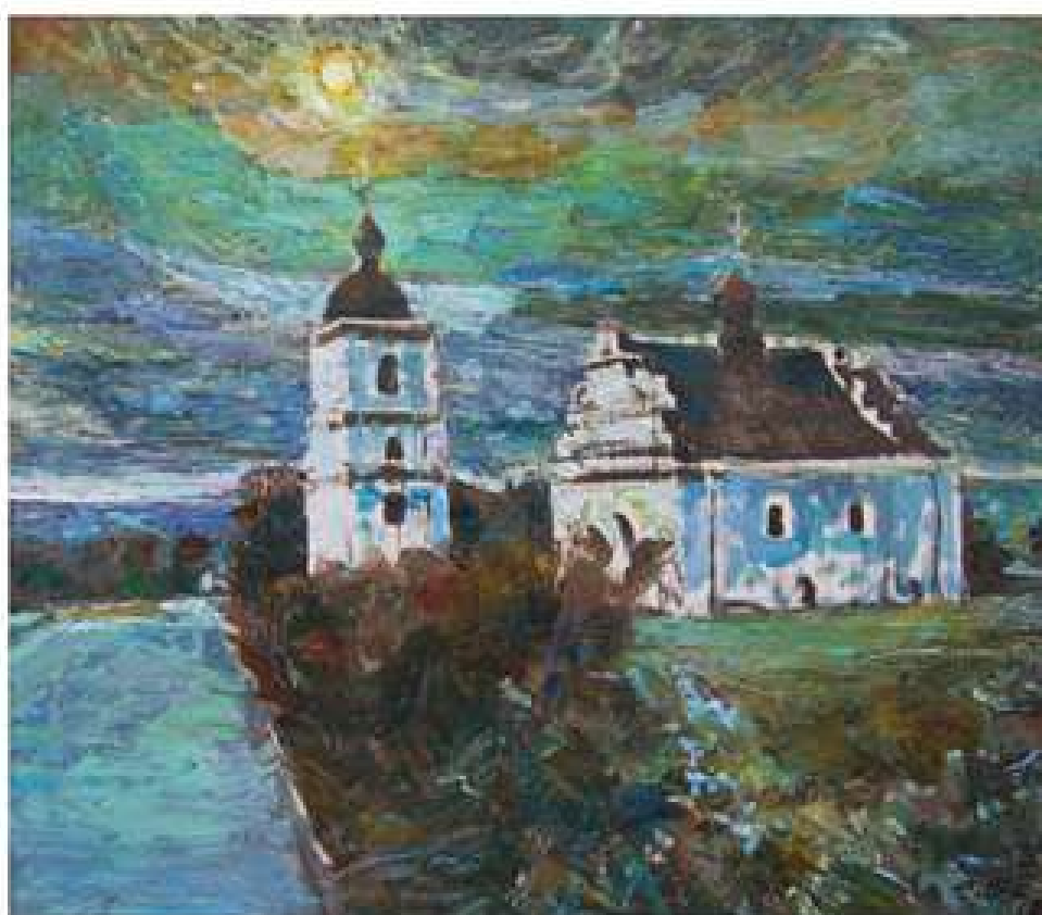
Вічність Богдана. 2018. Полотно, олія. 70x80.