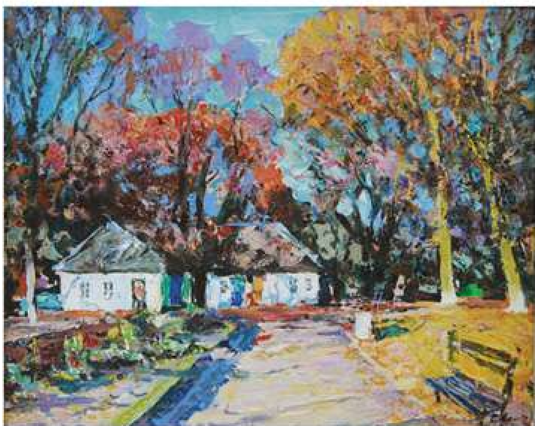
Хутір Надія. 2017. Полотно, олія. 65x80.