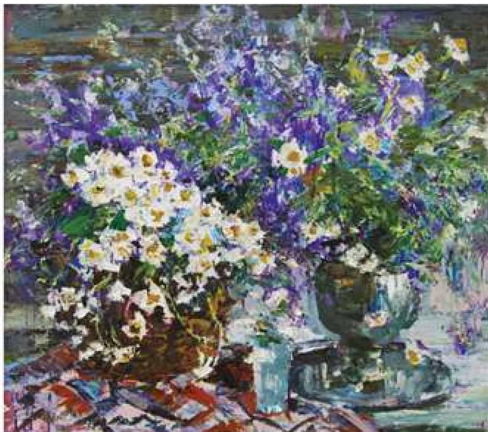
Поле надихас. 2020. Полотно, олія. 75x85