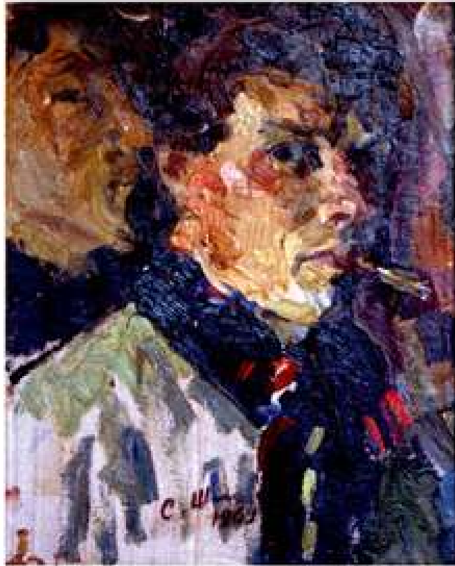
Автопортрет. 1969. Картон, олія. 33x28