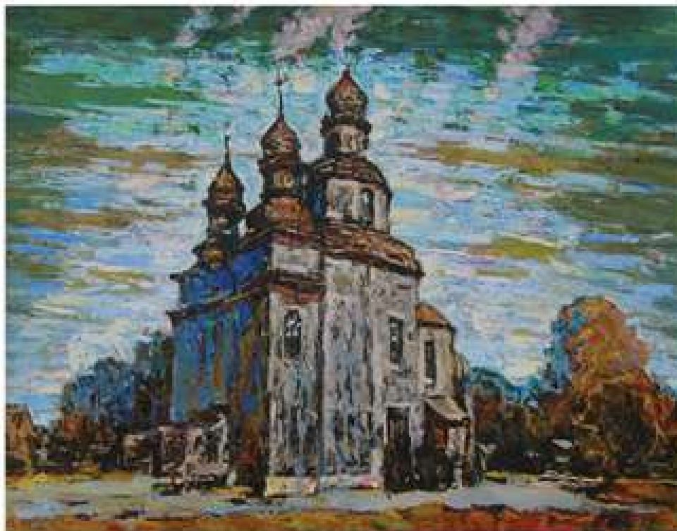
Плин часу. 2014. Полотно, олія. 70x90.