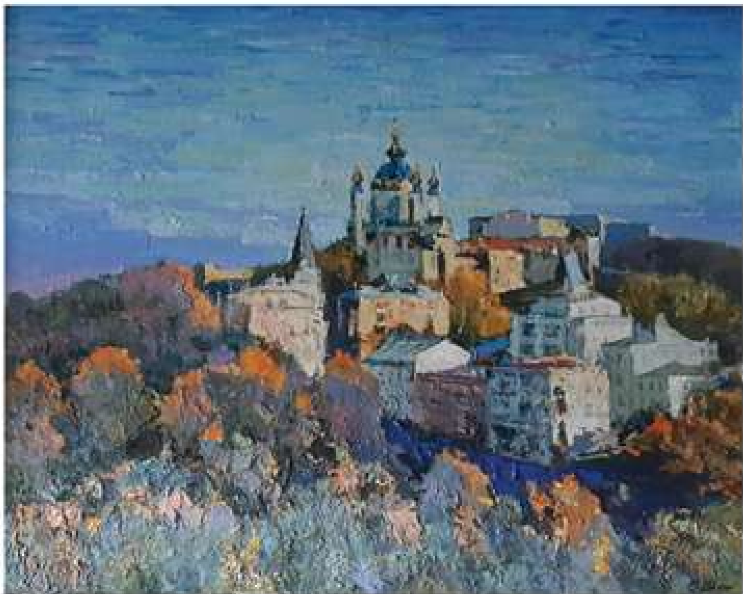
Величний храм. 2004. Полотно, олія. 79x87