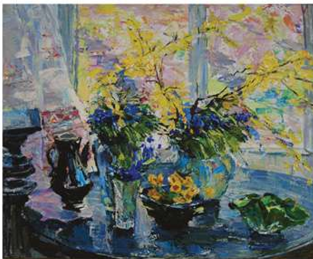
Знову весна. 2020. Полотно, олія.. 79x85