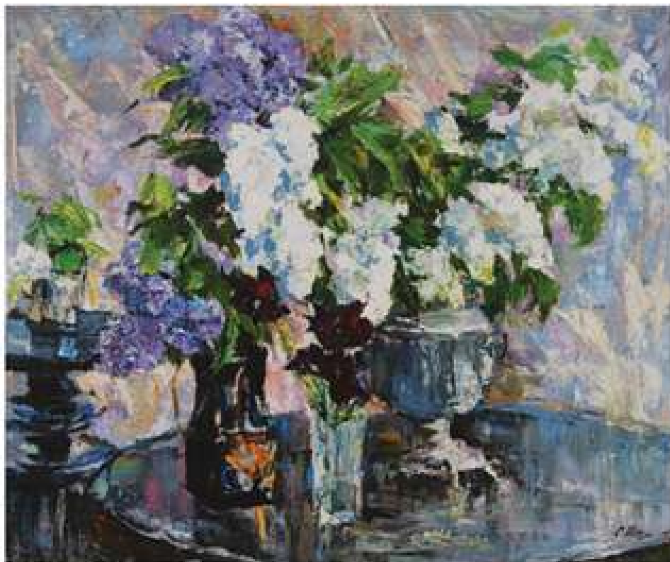
Весна пробуджується. 2020. Полотно, олія.. 70x90