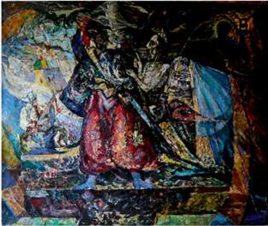
Козацький дух боротьби. 1997. Полотно, олія. 100x125