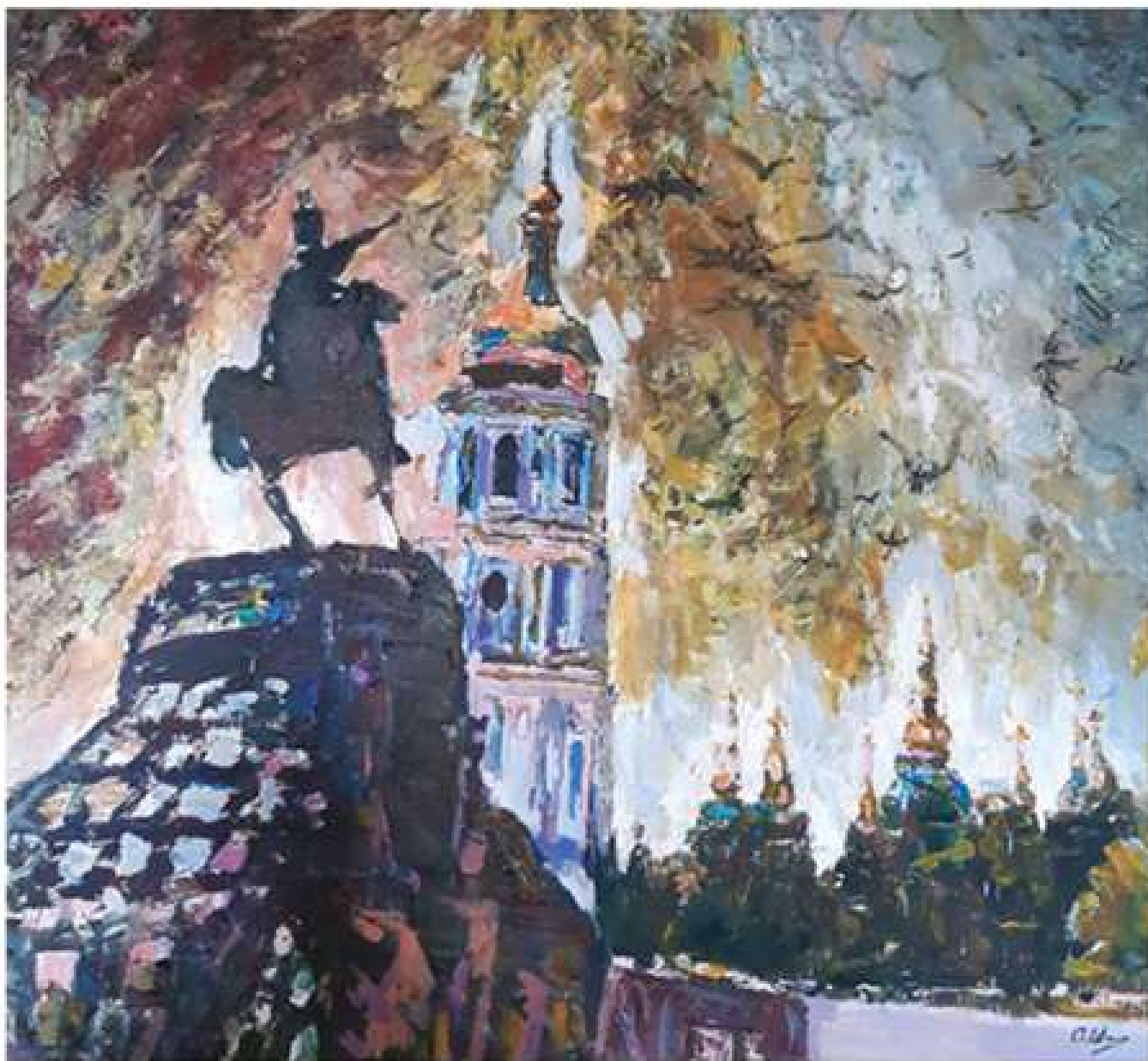
Клич Богдана. 2014. Полотно, олія.. 92x101