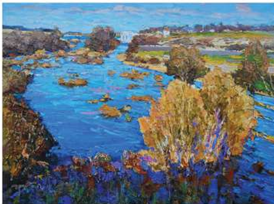
Річка Синюха. Промінь сонця. 2007. Полотно, олія. 77x100