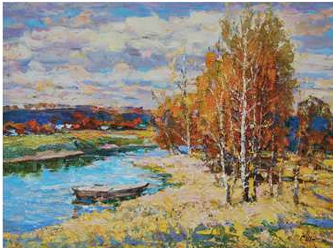
Осінній пейзаж. 2010. Полотно, олія. 67x90