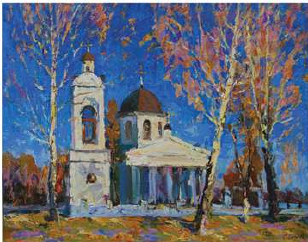
Осінь в Розумівці. 2011. Полотно, олія. 75x95