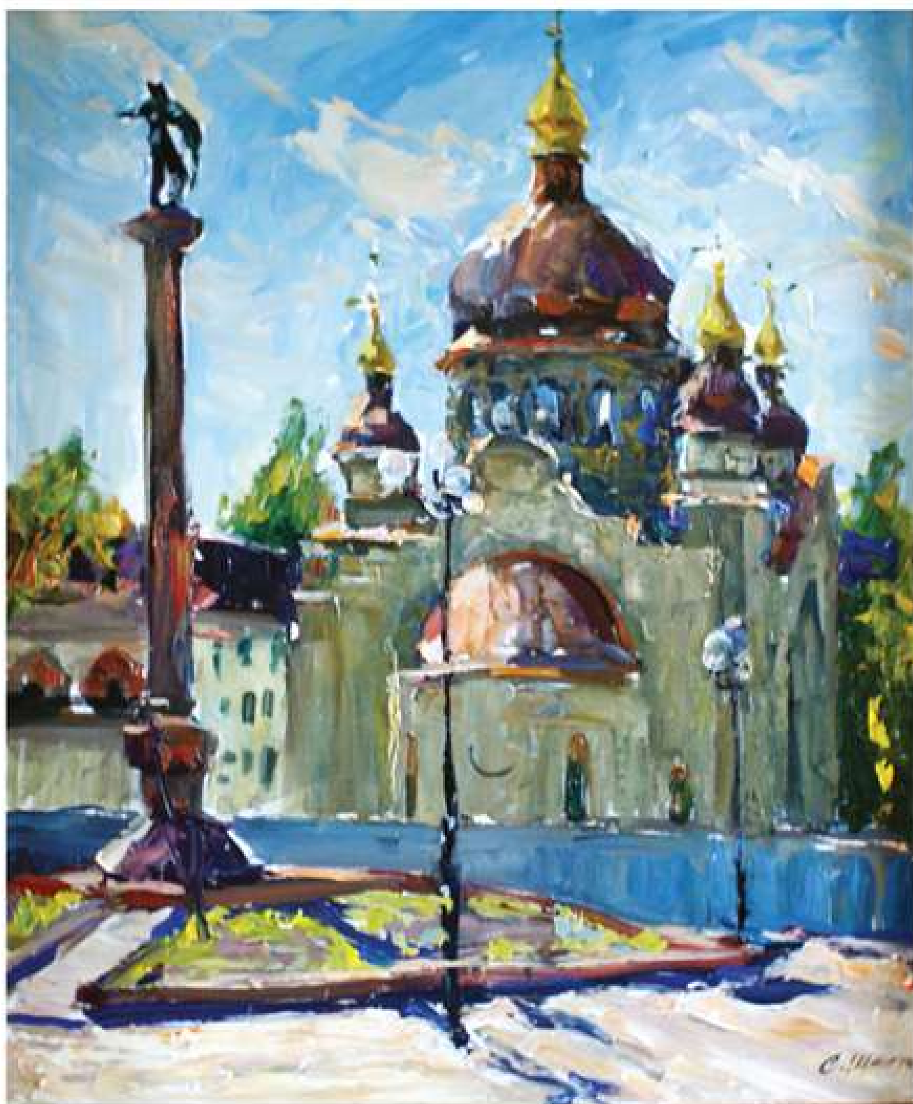
Будується храм. 2014. Полотно, олія. 85x70