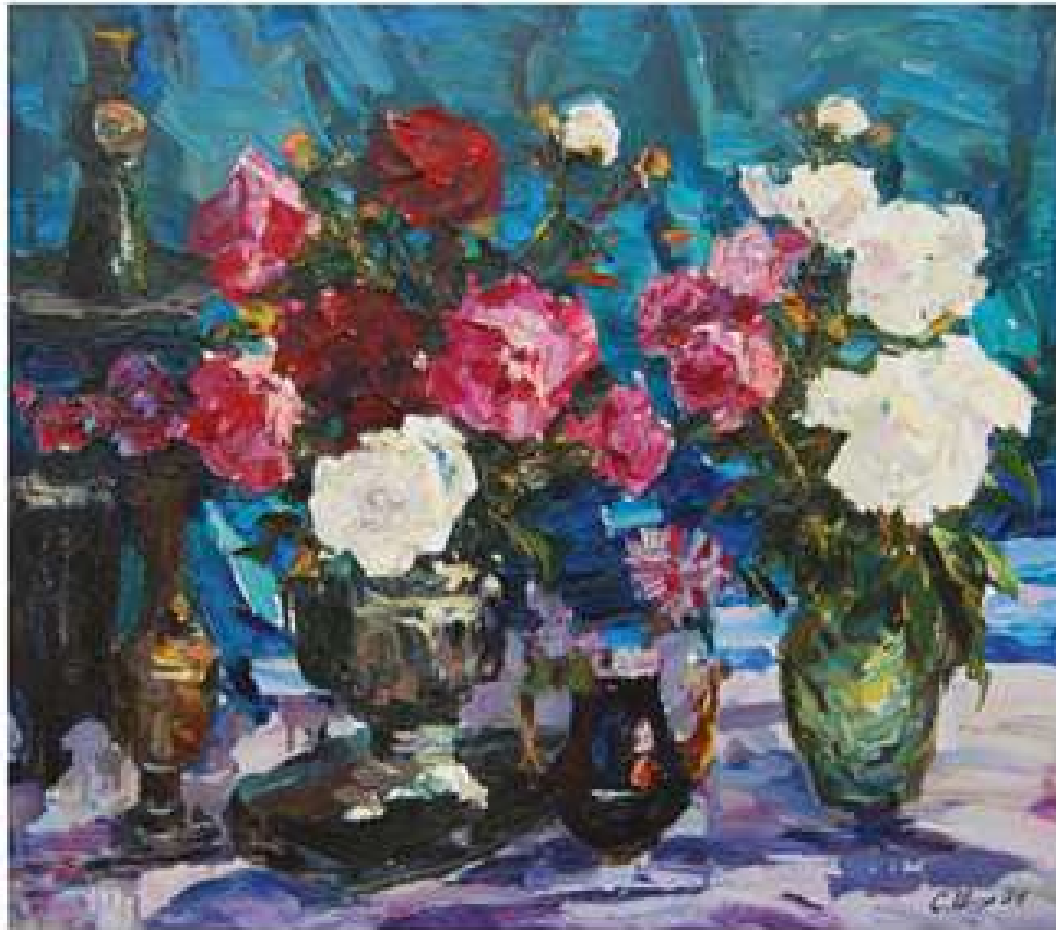
Півонії на зеленому. 2004. Полотно, олія. 70x80