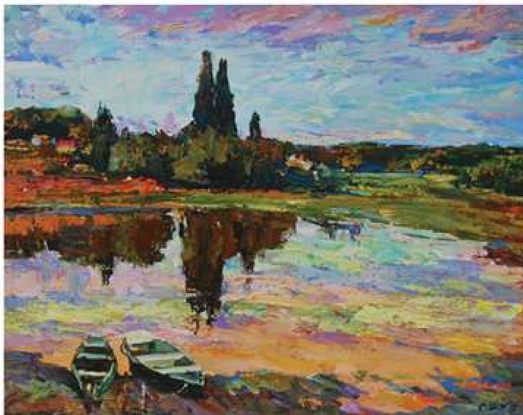
Теплий вечір. 2017. Полотно, олія. 70x95