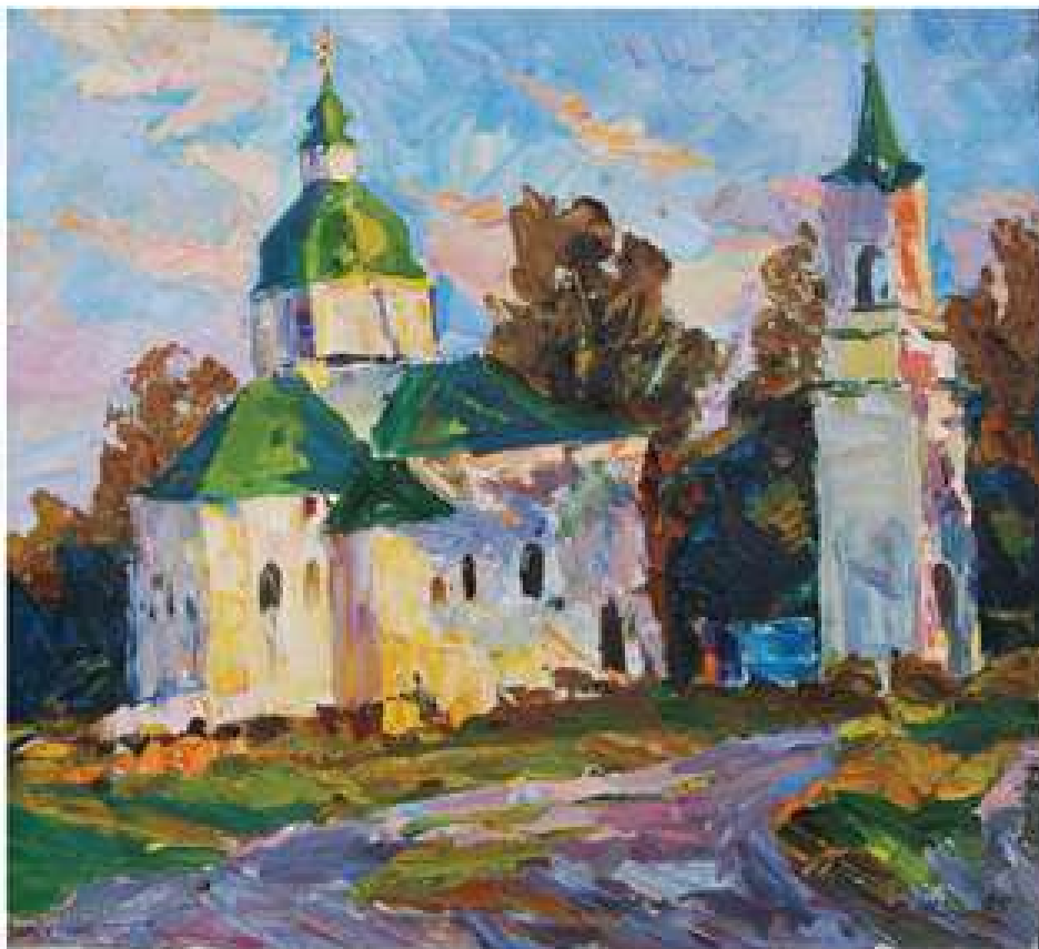
Відблиск сонця. 1985. Полотно, олія. 57x52,5