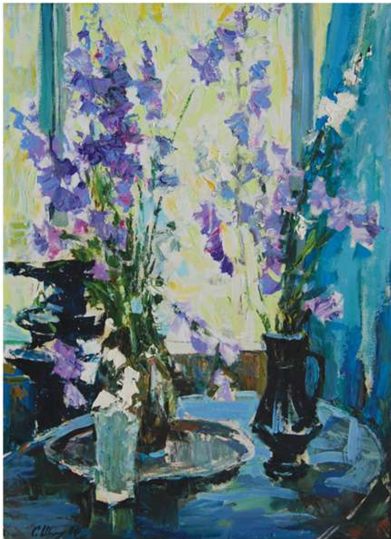
На вікні... 2014. Полотно, олія. 60x84