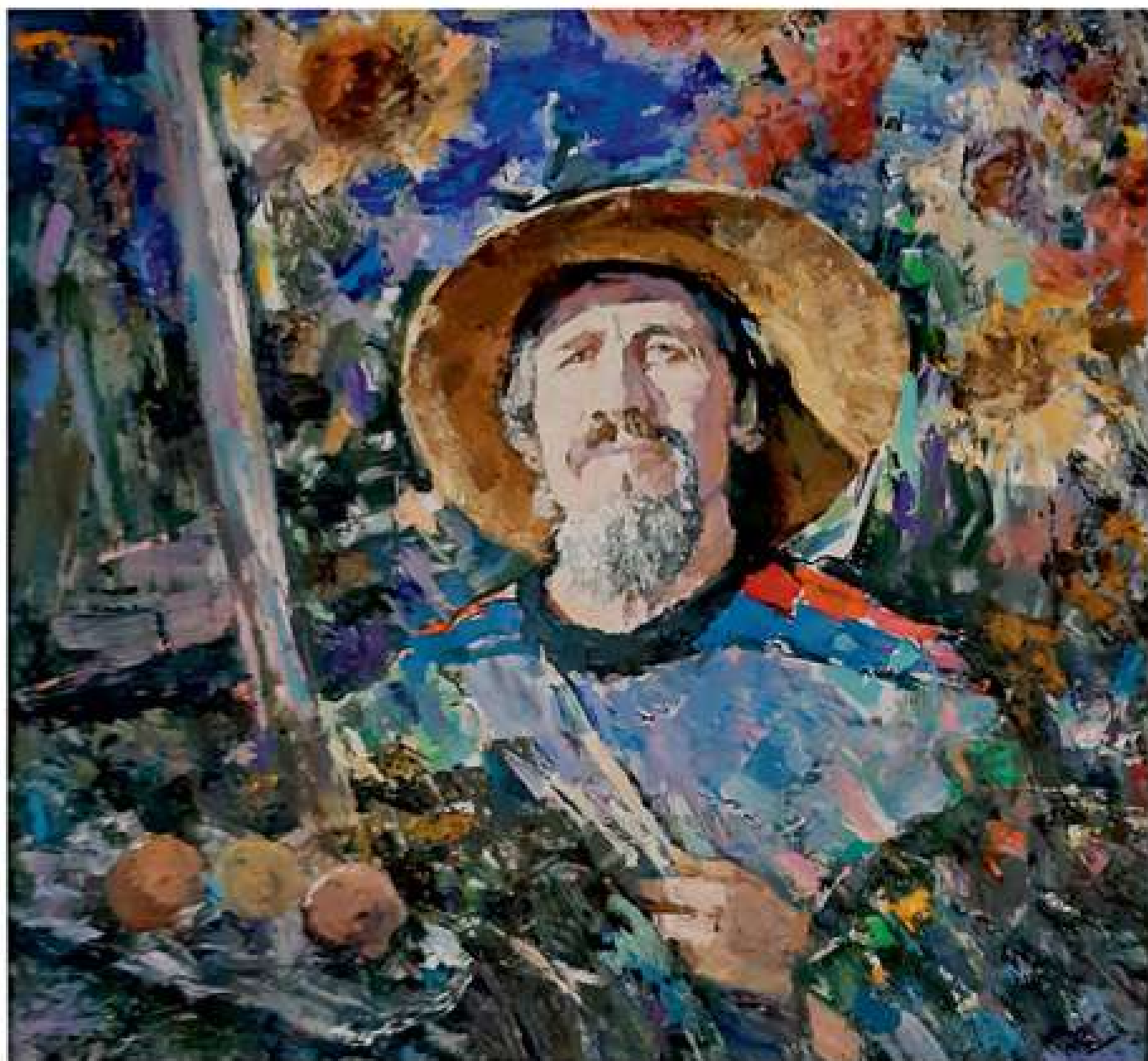
Автопортрет. 2017. Полотно, олія. 75x80