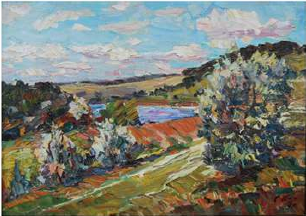
Велика Северинка. 1990. Полотно, олія. 50x70